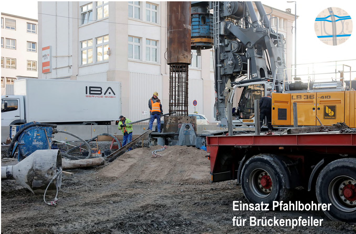
Einsatz Pfahlbohrer für Brückenpfeiler