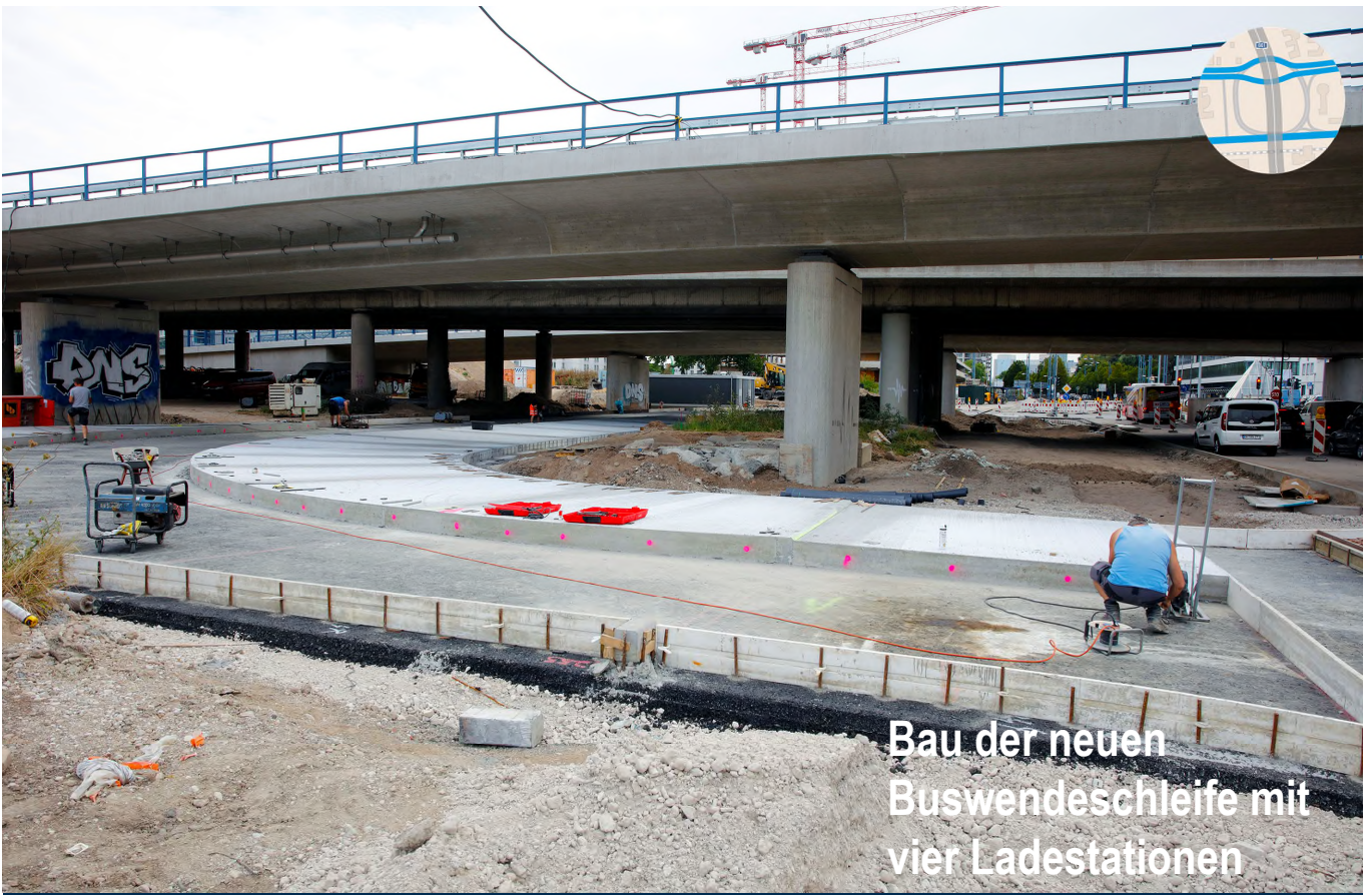
Bau der neuen Buswendeschleife mit vier Ladestationen