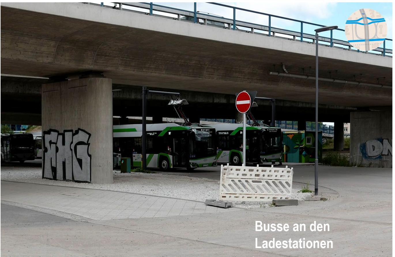
Busse an den Ladestationen