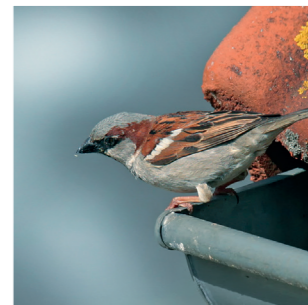
Hausperling – Name ist Programm. Gerne nistet er an Häusern 4