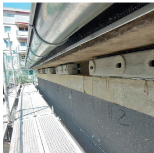
Mauerseglerkästen werden in die Dämmung integriert 3