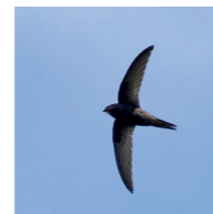
Mauersegler holen sich Mücken im Flug 4

Gefährdung: Verlust oder Entwertung von Gebäude-Winterquartieren durch Umnutzung oder Beseitigung von Spalten, Hohlräumen, Einflugmöglichkeiten; Schließung von Dachböden und Kirchtürmen