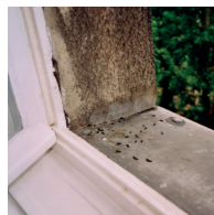
Fledermauskot vor dem Fenster 5

Fledermäuse, Hornissen, Spechte, Gartenrotschwanz, sowie alle Kleinvogelarten (Amsel, Drossel, Fink, Rotkehlchen)