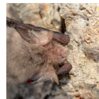
Zwergfledermaus – liebt Spaltenquartiere 4