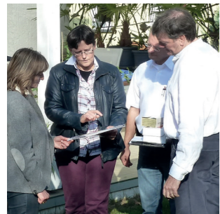
Energieberatung durch das Umweltamt 2