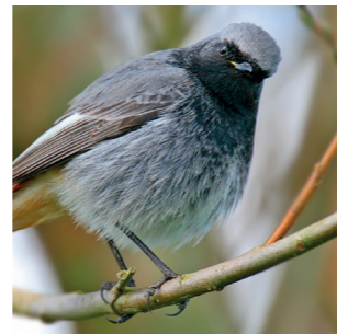
Hausrotschwanz – brütet auch gerne an Gebäuden 4