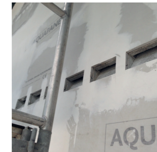
Fledermauskästen Wetterparkzentrum 2

Sollten Sie weitere Fragen zum Artenschutz haben, wenden Sie sich bitte an die Stadt Offenbach, das Amt für Umwelt, Energie und Klimaschutz und vereinbaren Sie einen kostenlosen Energieberatungstermin für eine energetische Sanierung.