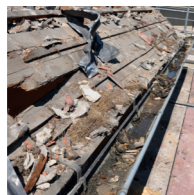
Dach mit Nestern 6