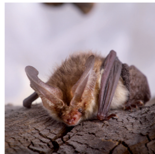
Die Fledermaus ist ortstreu, über Jahre verwendet sie die gleiche Bleibe 4