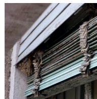
Spatzennistplatz im Jalousienkasten 6