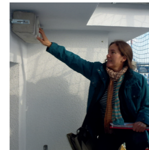
Anbringung von Nistkästen 2