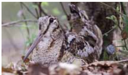
Die Tarnung der Waldschnepfe ( Scolopax rusticola ) ist so perfekt, dass der Vogel oft erst beim Auffliegen bemerkt wird

In lichten Waldbereichen mit Deckung durch Farne , Heidekraut oder Heidelbeersträucher kommt im „Erlensteg“ die heimliche Waldschnepfe vor.