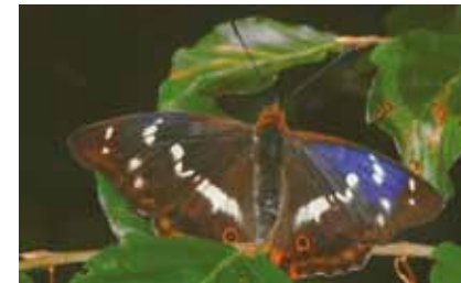
Große Schillerfalter ( Apatura iris ) saugen gerne Flüssigkeit an feuchtem Boden, kleinen Tierleichen und Exkrementen

Durch zeitweilige Bekämpfung der auch als „Forstunkräuter“ betrachteten Weiden und Espen war einer unserer schönsten Schmetterlinge, der „ Große Schillerfalter “, selten geworden. Heute werden diese Weichhölzer, auf denen die Raupen des Schillerfalters leben, als natürliche Mitglieder gesunder Wälder akzeptiert. Auf Blättern schattig stehender Salweiden legen die weiblichen Schillerfalter gerne ihre Eier ab.