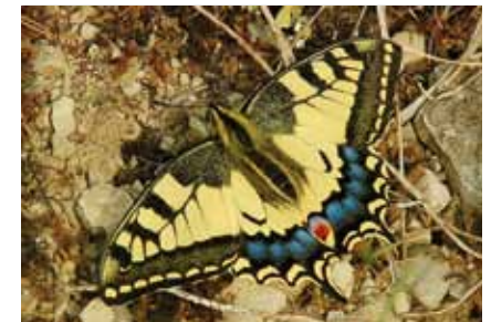
Der Schwalbenschwanz ( Papilio machaon ) ist in Offenbach der einzige Vertreter einer weltweit artenreichen Falterfamilie

An Kleearten leben die Larven einiger unserer schönsten Schmetterlinge, darunter mehrere Arten von Bläulingen und die metallisch schwarz und blutrot gezeichneten Widderchen . Auf der Wilden Möhre und anderen Doldengewächsen leben die Raupen eines unserer größten Tagfalter, des prächtig gelb und schwarz gefärbten Schwalbenschwanzes .