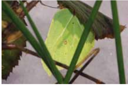
Überwinternder Zitronenfalter ( Gonepteryx rhamni ) – das Brombeerblatt über dem Schnee bietet kaum Schutz

Der Zitronenfalter ist häufig und dennoch außergewöhnlich: Frei sitzend oder versteckt unter Blättern, überwintern die von Juni bis Juli ausschüpfenden Falter, gegen Erfrieren durch einen dem Kühlerfrostschutz chemisch ähnlichen Stoff geschützt.