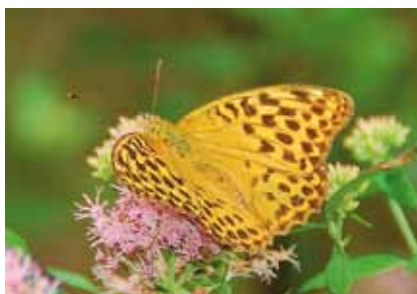
Der Kaisermantel ( Argynnis paphia ), hier ein Weibchen, ist im Lohwald noch häufig anzutreffen

Aus floristischer Sicht besonders bedeutsam sind an lichterem Stellen die Schwalbenwurz und der Echte Steinsame . Auf sonnigen Waldwegen mit geringerem Kalkgehalt im Boden blüht stellenweise das kräftig rosa gefärbte Echte Tausengüldenkraut .