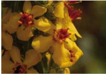
Bis zu 1,5 Meter Höhe erreichen die goldgelben Blütenrispen der Schwarze Königskerze ( Verbascum nigrum )

Rumpenheim sind die Raine meist schmal und artenarm.