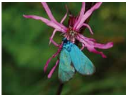
Grünwidderchen ( Adscita sticticus ) sind nur noch selten auf den Wiesen im NSG und an der Bieber zu beobachten

Unmittelbar nördlich der Autobahn A 3, zwischen einem Mischwald mit Eichen, Buchen und Kiefern im Westen und der in diesem Abschnitt stark kanalisierten Bieber, erstreckt sich eine etwa ein Hektar große Nasswiese mit Seggen und Sumpfschwertlilien. Die höher liegenden, trockeneren Abschnitte mit Süßgräsern werden einschürig als Heuwiese genutzt. Zwischen Grauweiden verborgen