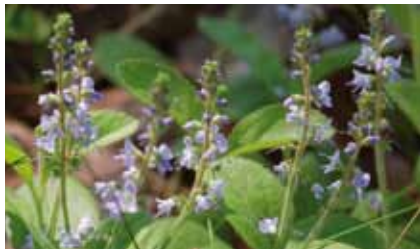
Der Waldehrenpreis ( Veronica officinalis ) ist eine typische Pflanze gelichteter Wälder und sonniger Waldränder

Siedlungsgründungen in der Jungsteinzeit brachten die ersten nachhaltigen Eingriffe in die Wälder. Für den Anbau von Nahrungspflanzen und zum Bau der Hütten mussten Flächen gerodet und gut gewachsene Bäume gefällt werden. In die Rodungsflächen wanderten Licht liebende Pflanzen ein.