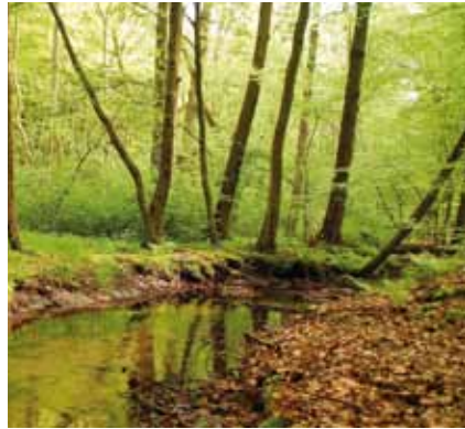
Der Erlen-Eschen-Bachauenwald am oberen Hainbach ist ein seltener Lebensraumtyp, der Schutz braucht

aufgenommen. Am südlichen Stadtrand Offenbachs, sollten wir deshalb mit diesem ökologisch wertvollen Lebensraum sorgsam umgehen, Verunreinigungen und Beeinträchtigungen vermeiden.