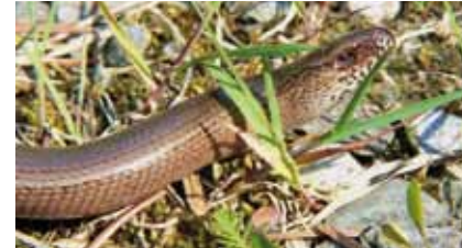
Die Blindschleiche ( Anguis fragilis ) ist eine beinlose Eidechse

In dieser Fläche sind als floristische Besonderheiten der Deutsche Ginster mit dem einzigen Bestand in Offenbach sowie der Hügelklee zu finden.