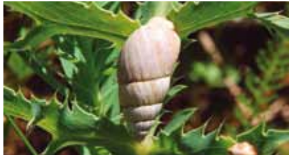
Weiße Turmschnecke ( Zebrina detrita ) auf einem Blatt von Feld-Mannstreu ( Eryngium campestre )

Wirbeldost, Weiße Turmschnecke , zahlreiche Tagfalterarten, Wolfsmilchschwärmer, Dorngrasmücke, Goldammer und Neuntöter sind nur einige der vielen hier vorkommenden Arten.