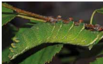
Die Raupe des Birkenspinners ( Endromis versicolora ) unterstützt mit ihrer Haltung die Wirkung ihrer Tarnfärbung

Durch ihre Tarnfärbung und Haltung sind sie sogar vor den scharfen Augen Insekten fressender Vögel geschützt.