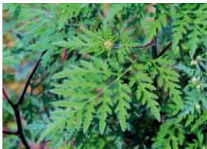
Die Beifuß-Ambrosie ( Ambrosia artemisiifolia ) zählt zu den gefährlichsten allergenen Pflanzen

Die Beifuß-Ambrosie wurde im 18. Jahrhundert aus Nordamerika in einige