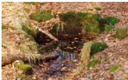
Die verfallene Fassung des „Kaiser-Friedrich-Borns“ ist ein Rest einer alten Wasserversorgungsanlage

Eine dieser Quellen, der damals noch sehr ergiebige „ Kaiser-Friedrich-Born “ östlich der Dietzenbacher Straße, wurde im späten 19. Jahrhundert mit Mauersteinen eingefasst und an die erste städtische Trinkwasserleitung angeschlossen.