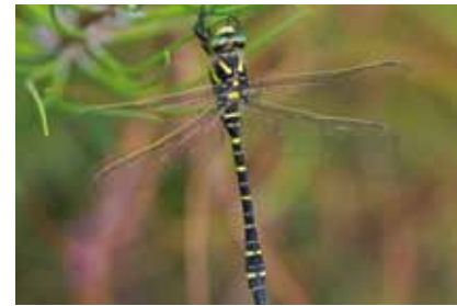
Die Zweigestreifte Quelljungfer ( Cordulegaster boltoni ) ist hauptsächlich ein Mittelgebirgstier

Wer sich vorsichtig dem Ufer nähert, kann in schwach strömenden Abschnitten des Hainbachs Gruppen von kleinen Fischen beobachten. Es handelt sich um den Dreistacheligen Stichling . Diese einzige Fischart des oberen Bachabschnitts ernährt sich von kleinen Wasserinsekten und jungen Bachflohkrebsen , die in Ansammlungen von sich zersetzenden Blättern und Holzresten im Wasser zu Tausenden leben. In Sandbänken graben die räuberischen Larven einer unserer größten Libellen, der Zweigestreiften Quelljungfer , nach Würmern und anderen Kleintieren. Ihr Auftreten in Offenbach ist erst seit wenigen Jahren bekannt und besonders bemerkenswert, weil diese Art hauptsächlich an kühlen Mittelgebirgsbächen vorkommt.