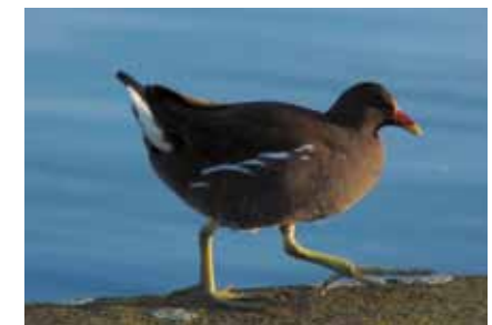
Die Teichralle ( Gallinula chloropus ), auch grünfüßiges Teichhuhn genannt, brütet an allen Parkteichen Offenbachs

Die Insekten bieten Buntspecht, Kleiber, Meisen und Grasmücken Nahrung. In der Dunkelheit werden Wildschweine und Marder aktiv. Selbst Fuchsbauten kann das geübte Auge entdecken! Der Ruf des Waldkauzes ist weithin zu hören. In Parkteichen leben Fische und Wasserinsekten. Stockente, Teichralle, Blässlralle, Nilgans und Schwan brüten dort regelmäßig. Fischende Graureiher lauern am Ufer auf Beute.