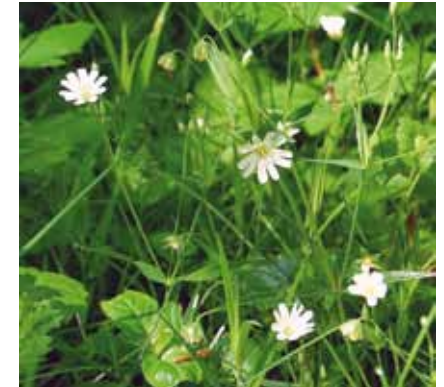
Die Großblütige Sternmiere ( Stellaria holostea ) wächst auf frischen, nährstoffärmeren Standorten im Halbschatten

Auf nährstoffärmeren, lichten Stellen mit Eichen , Hainbuchen und Buchen blühen im Frühjahr ausgedehnte Bestände der Großblütigen Sternmiere .