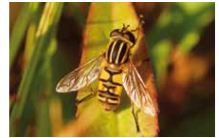
Schwebfliegen ( Syrphidae ) sind häufige Blütenbesucher; wespenähnliche Zeichnungsmuster schützen vor Feinden

Ständige Beweidung magert den Boden aus, da die in den Pflanzen enthaltenen Nährstoffe von den Weidetieren zum Wachstum oder zur Milchproduktion verbraucht werden. Deshalb vermehren sich im Lauf der Zeit neben den vom Vieh gemiedenen Pflanzen anspruchslose Arten, die auch gelegentliche Tritte vertragen. Wir kennen diese Pflanzen als Bewohner blütenreicher Blumenwiesen und „Magerrasen“. Zahlreiche Blütenbesucher finden hier Nektar und Pollen.