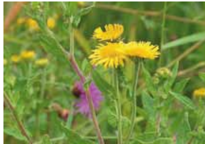
Das Ruhr-Flohkraut ( Pulicaria dysenterica ) ist in Offenbach als botanisches Kleinod zu betrachten

Sumpfdotterblume bilden bunte Farbtupfer in diesen Nasswiesen und Sümpfen. Eine besonders artenreiche Feuchtwiese liegt in der Talmulde des Buchhügelgrabens südlich der Sportanlage des Vereins „Gema Tempelsee“.