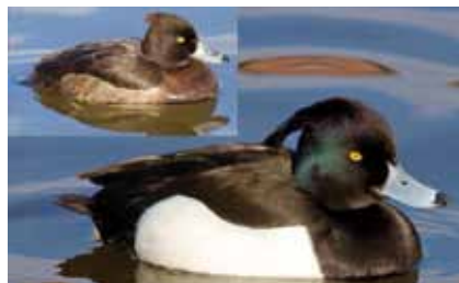
Reiherenten ( Aythya fuligula , oben ein Weibchen) sind im Schutzgebiet als häufige Wintergäste zu beobachten

arten attraktiv als Rast- und Überwinterungsplatz. Engagierte ehrenamtliche Naturschützer setzten sich deshalb schon früh dafür ein, die ehemalige Kiesgrube zum Naturschutzgebiet zu erklären.