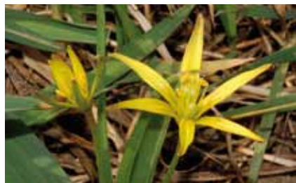
Der Acker-Gelbstern ( Gagea villosa ) blüht im Frühjahr noch vereinzelt auf den Feldern rund um Rumpenheim

Mit den Nutzpflanzen kamen auch die Samen zahlreicher Wildkräuter nach Mitteleuropa. Mohn, Kornblumen und Acker-Krummhals sowie die giftige Kornrade , Ackerstiefmütterchen , Venuspiegel , Echte und Hundskamille und viele andere Arten sind seit dieser Zeit bei uns heimisch. Feldsalat , ehemals ein Ackerunkraut, wurde sogar kultiviert und zur beliebten Salatpflanze „geadelt“.