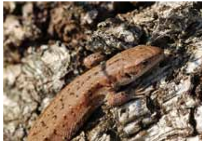
Waldeidechsen ( Zootoca vivipara ) liegen beim Sonnen gerne auf trockenen Baumstümpfen oder abgebrochenen Ästen

Die Ausbreitung der Birken hat an diese Baumart gebundene Insekten, darunter den in Hessen gefährdeten Birkenspinner , gefördert. Mit scharfen Augen und etwas Glück können wir die Raupen des attraktiven Nachtfalters im Mai in kleinen Gruppen an den oberen Zweigen junger Birken finden.