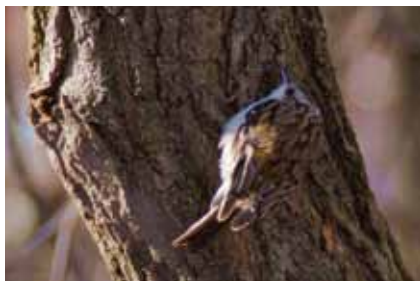
Der Waldbaumläufer ( Certhia familiaris ) inspiziert bei der Suche nach kleinen Insekten und Spinnen jede Rindenritze

tritt meist in der Nähe von Birken auf. Es ist sicherlich einzusehen, dass die Zerstörung giftiger oder unbekannter Pilze die Gesundheit in der Nähe stehender Bäume schädigen kann und daher als Naturfrevel zu betrachten ist.