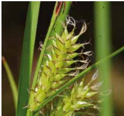
Blasensegge ( Carex vesicaria ) ist eine typische Vertreterin ihrer artenreichen Gattung

Hoch anstehendes Grundwasser, geringer oder fehlender Abfluss und gute Nährstoffversorgung des Bodens lassen spezielle Pflanzengesellschaften entstehen.