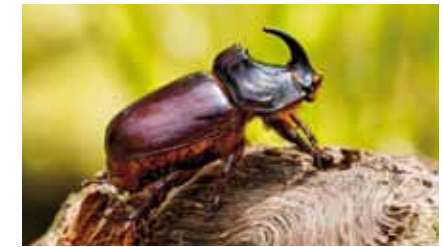
Der früher sehr seltene Nashornkäfer ( Oryctes nasicornis ) legt seine Eier heute gerne in Komposthaufen in Hausgärten

Mit alten Bäumen und einem sehr hohen Totholzanteil bieten der Leonhardt-Eisnert-Park und andere Parks vielen Insekten Lebensräume. Hier findet man sogar den imposanten Nashornkäfer , dessen Larven in Komposthaufen der umliegenden Gärten aufwachsen.