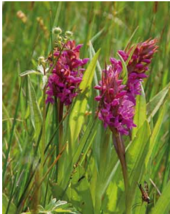
Das Breitblättrige Knabenkraut ( Dactylorhiza majalis ) kann als „Wappenflechte“ des Naturschutzgebiets bezeichnet werden

Im Südosten von Bieber, zwischen Kleingärten im Norden, der Autobahn A 3 im Süden, der Heusenstammer Feldschneise im Osten und der S-Bahntrasse nach Dietzenbach im Westen, liegt ein Komplex unterschiedlicher, teils seltener, Biotoptypen. Gutachter haben hier über 370 Arten von Farn- und Blütenpflanzen gefunden, darunter viele gefährdete oder stark gefährdete Arten. Dieser Artenreichtum war neben stark gefährdeten Brutvogelarten und seltenen Insekten Anlass, das Gebiet im Jahr 1996 unter Naturschutz zu stellen.