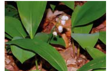
Das stark giftige Maiglöckchen ( Convallaria majalis ) sollte nicht mit dem Bärlauch ( Allium ursinum ) verwechselt werden

Auf einen Saum von Dornsträuchern mit Schlehen, Kreuzdorn, Wildrosen, Brombeeren, Weißdorn und Hartriegel folgt bis zum Deponiehügel mit alten Kiefern untermischter Laubwald. Lichtere Flächen sind von Maiglöckchen oder Einblütigem Perlgras bedeckt. ■