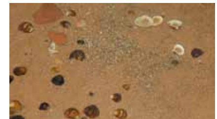
In Spülsäumen sind Schalen asiatischer Körbchenmuscheln ( Corbicula ) inzwischen häufiger als jene einheimischer Arten

Von Muscheln und Wasserschnecken ernähren sich hauptsächlich die rastenden und überwinternden Reiher- und Tafelenten . Auf den Wiesen und Feldern weiden im Winter Graugänse . Seltener sind in dieser Zeit auch Löffel-, Krick-, Knäk-, Pfeif-, Schnatter- und Schellenten zu Gast. Neben heimischen Lachmöwen treten im Winter Sturm- und Silbermöwen, Fluss- und Zwergseeschwalben auf.