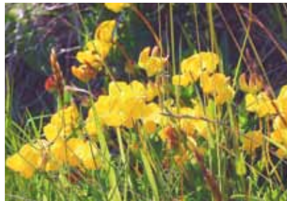
Hornklee ( Lotus corniculatus ) ist die Nahrungspflanze einiger unserer schönsten Schmetterlingsarten.

Viele Pflanzen aus der Familie der Schmetterlingsblütler können Stickstoffmangel im Boden, ausgleichen, weil sie mit Hilfe von Bakterien Luftstickstoff chemisch binden und in Wurzelknöllchen speichern können. Der leuchtend gelbe Hornklee , weitere Kleearten und die rosa und weiß blühende Bunte Kronwicke sind auf ungedüngten Wiesen und an den Böschungen der Maiddämme zu finden.