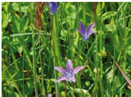
In feuchteren Wiesen entfaltet die blauviolette Wiesenglockenblume ( Campanula patula ) ihre zarten Blüten

Die sonnige, feuchtere Wiese im Nordwesten ist im Juni von rosaroten, filigranen