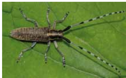
Die Larven des Distelbocks ( Agapanthia villosoviciridescens ) wachsen in den Stängeln von Disteln und Kletten heran

Die Tellerblüten der Weißer Lichtnelke beginnen mit Einbruch der Dunkelheit zu duften und Nachtfalter anzulocken. Zahlreiche Insektenarten sind in ihrer Entwicklung von diesen Kräutern abhängig. Wegen ihres Artenreichtums sind die Raine gesetzlich geschützt.