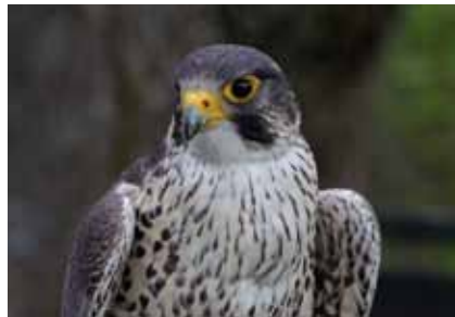
Verfolgung durch Taubenhalter und Schäden durch Pestizide hatten den Wanderfalken ( Falco peregrinus ) fast ausgerottet

Kirchen bieten einen ganz besonderen Lebensraum für scheue Tierarten. Hoch über der Stadt haben Schleiereule, Dohle und Turmfalke Ruhe, ihre Jungen aufzuziehen. Seit über 20 Jahren brüten in einem Nistkasten am Schornstein der EVO Wanderfalken . Diese sehr seltene Greifvogelart fasst nach jahrzehntelanger direkter Verfolgung und Brutausfällen infolge intensiven Pestizideinsatzes in der Landwirtschaft bis in die 1980er Jahre langsam wieder Fuß. Als ursprünglicher Felsbewohner besiedelt er gerne hohe Gebäude als „Felsersatz“. Von hohen Sitzwarten startet er zu regelmäßigen Jagdflügen, bei denen er unter anderem verwilderte Stadttauben erbeutet, deren Vorfahren, die Felsentauben , wie der Wanderfalke Felsenbrüter waren.