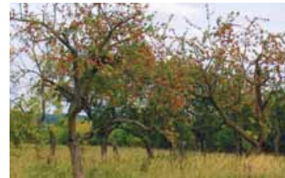
Im Rahmen eines Naturschutzprojektes wird das Streuobstwiesenrelikt am Südrand des Lohwalds erhalten

Letzte Zeugen einer extensiven Landbewirtschaftungsform sind die kleinen Bestände hochstämmiger Obstbäume auf „Streuobstwiesen“ am Rand von Bieber und um Bürgel und Rumpenheim. Das Grünland unter den Bäumen wurde ehemals ein- bis zweimal jährlich gemäht oder als Weide genutzt. Heute sind die meisten Bestände von Wurzelbrut der Pflaumen und Mirabellen sowie von Brombeeren und Wildrosen überwuchert.