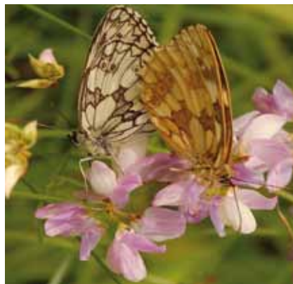
Der Schachbrettfalter ( Melanargia galathea ) wanderte erst im 20. Jahrhundert bis nach Norddeutschland

Sie ermöglichten, mehr Tiere zu halten und Heu als Winterfutter einzulagern. Bis ins 18. Jahrhundert war die „Waldweide“ mit winterlicher Gehege- oder Stallhaltung verbreitet; sie hat sich in Süd- und Südosteuropa bis heute erhalten. Die uns natürlich scheinenden blumenreichen Wiesen entstanden erst in den letzten beiden Jahrhunderten durch planmäßige Wiesenwirtschaft. Begünstigt durch diese Entwicklung, breitete sich der an Gräser gebundene Schachbrettfalter erst im 20. Jahrhundert nordwärts aus.