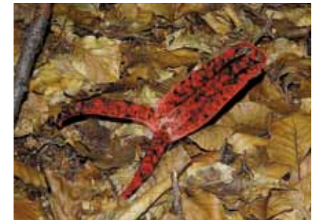
Der Tintenfischpilz ( Clathrus archeri ) ist in Offenbach und Umgebung inzwischen nicht mehr selten

Einzelne Tintenfischpilze konnten schon im Leonhard-Eißnert-Park, im Stadtwald