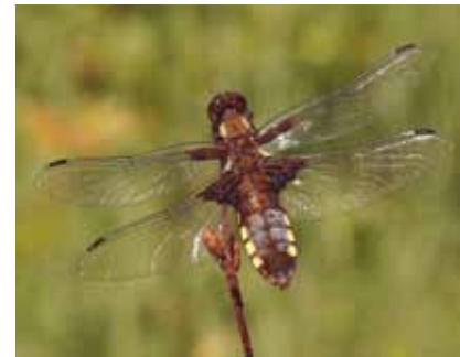
Plattbauchlibelle ( Libellula depressa ), hier ein altes Weibchen, tauchen bald an neu entstandenen Gewässern auf

Wasservögel und Wind bringen weitere Pflanzenarten mit. Besonders schnell erfolgt die Ansiedlung von Rohrkolben und Schilf , deren Samen über große Entfernungen vom Wind transportiert werden. Als Pioniere können sie in kurzer Zeit dichte Röhrichtbestände entwickeln.