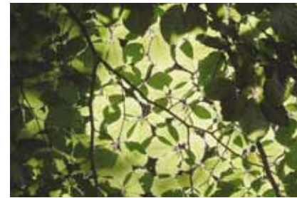
Ältere Buchen ( Fagus silvatica ) bilden ein dichtes Laubdach, so dass man im dämmerigen Licht an eine Halle erinnert wird

ausgewiesen. Solche Flächen werden nicht forstwirtschaftlich genutzt und sollen sich ungestört zu natürlichen, artenreichen Lebensräumen entwickeln. Ein völlig anderer Waldtyp begegnet uns an den Standorten, wo kalkhaltiges Gestein bis dicht unter der Oberfläche ansteht. Auf den neutralen bis leicht basischen Böden mit guter Nährstoffversorgung im Lohwald, Leonhard-Eißnert-Park und Waldpark, im Waldstreifen zwischen Tempelsee und Bieber, hinter der Rosenhöhe und in der Umgebung des Buchrainweiher wachsen besonders hohe Buchen mit gerade gewachsenen Stämmen im typischen Kalkbuchenwald . Das unter dem dichten Kronendach herrschende Dämmerlicht lässt diesen Wald wie eine große Halle erscheinen. Deshalb werden solche Wälder auch als Hallenbuchenwälder bezeichnet. Sie kommen nur im klimatisch gemäßigten Europa vor.