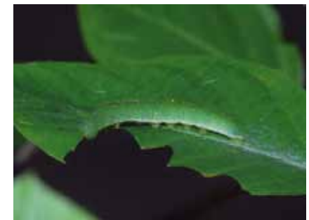
Die tarnfarbige Raupe des Zitronenfalters ( Gonepteryx rhamni ) verrät ihre Anwesenheit durch ihre Fraßspuren

Nur an seinen Blättern und an dem im Lohwald vorkommenden Kreuzdorn entwickeln sich die Raupen des Zitronenfalters .