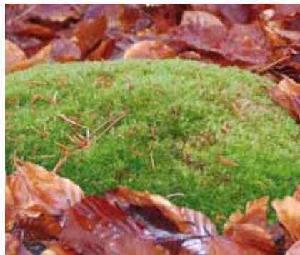
Auf mageren Standorten im Stadtwald südlich von Tempelse wachsen Polster von Weißmoos ( Leucobryum glaucum ).

Lichtmangel in den später aufgeforsteten Bereichen, allmähliche Neubildung von Humus und die Düngung durch „sauren Regen“ und Staub haben diese Magerkeitszeiger wieder seltener werden lassen. Lediglich der anspruchslose Besenginster ist an sonnigen Stellen noch häufiger zu finden.