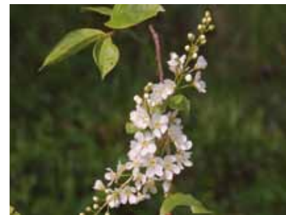
Der Duft blühender Traubenkirschen ( Prunus padus ) erfüllt im Frühling Wald und Wiesen im Naturschutzgebiet

Gutachter fanden in einer 200 Jahre alten Karte an der Stelle des urwüchsig erscheinenden Sumpfwaldes Wiesen oder Äcker dargestellt. Verfallene Entwässerungsgräben sind dort noch zu sehen. Jetzt ist dieser Bereich der natürlichen Entwicklung überlassen. Nässe ertragende Moose , Sumpflappenfarn , Binsen , Walzensäge , Sumpfreitgras und Pfeifengras bilden hier die Bodenvegetation. In der Strauchschicht wachsen Wildformen von schwarzen und roten Johannisbeeren .