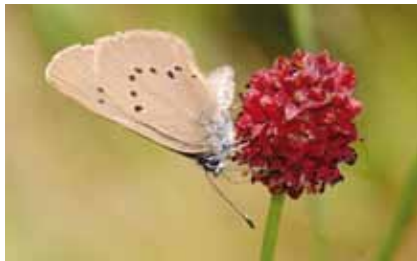
Ein Weibchen des Dunklen Wiesenknopf-Ameisenbläulings ( Glaucopsyche nausithous ) prüft die Blüten vor der Eiablage

Unter dem Namen Pimpernelle ist der Große Wiesenknopf eine der sieben Zutaten der „Frankfurter Grie Soß“. Im Leben des „ Dunklen Wiesenknopf-Ameisenbläulings “ spielt er eine zentrale Rolle: Die Raupen des kleinen Falters leben in seinen Blüten, bis sie etwa 5 mm groß sind. Im Frühherbst verlassen sie die Blütenköpfe und übersiedeln in Nester von Wiesenameisen der Gattung Myrmica .