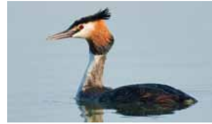
Der Haubentaucher ( Podiceps cristatus ) ist im Naturschutzgebiet seit Jahren ein regelmäßiger Brutvogel

Nutzungsansprüche von Anglern, Schwimmern und Modellbootfahrern wurden in modellhafter Weise berücksichtigt: Es wurde ein Naturschutzgebiet ausgewiesen, in dessen südlichem Bereich Baden, Angeln und das Einsetzen von Modellbooten gestattet sind. Der nördliche Abschnitt darf nicht betreten werden. Diese Regelung hat sich bisher bewährt. Trotz sommerlichen Badebetriebs brütet der seltene Haubentaucher regelmäßig, eine große Zahl von Kormoranen übernachtet im Nordwesten des Schutzgebiets.