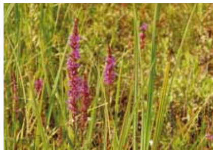
Blutweiderich ( Lythrum salicaria ) ist für viele Insekten besonders eine beliebte Nektarquelle an feuchten Standorten

Einige dieser Tümpel müssen dringend gereinigt werden, da der aus Falllaub entstandene Faulschlamm giftigen Schwefelwasserstoff freisetzt. Im Boden ruhende Samen