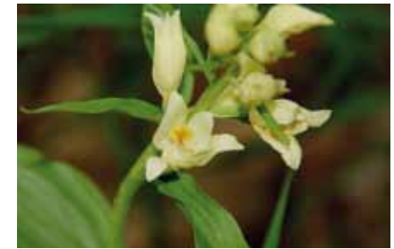
In Offenbach findet man das Weißes Waldvöglein ( Cephalanthera damasonium ), selten mit weit geöffneten Blüten

Im rotbraunen vorjährigen Buchenlaub ist diese Orchidee schwer zu entdecken. Hat man erst einmal eine Pflanze gefunden, findet man in der Umgebung oft noch weitere bis zu 35 cm hohe Exemplare. An etwas lichterem Stellen kommen zwei weitere Orchideenarten vor: Die Breitblättrige Stendelwurz und das Weißes Waldvöglein . Nur selten sind beim Weißes Waldvöglein die Blüten so schön geöffnet