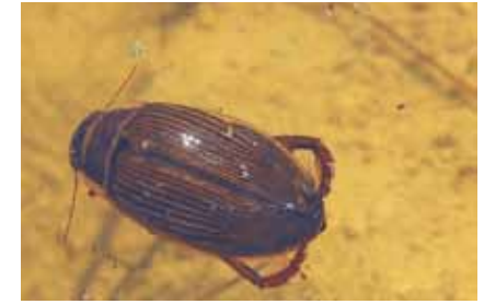
Gelbrandweibchen ( Dytiscus marginalis ); im Gegensatz zu Männchen haben weibliche Tiere längs gefaltete Flügeldecken

Ihr breiter, flacher Hinterleib, hellblau bei den Männchen, bei den Weibchen mit gelben Randflecken, macht sie unverwechselbar. Mit etwa 20 weiteren Libellenarten, dem Gelbrandkäfer und anderen Wasserinsekten hat sie die 1998 und 2008 neu angelegten Tümpel im Wald südlich der S-Bahnlinie von Bieber nach Obertshausen schnell besiedelt. Gelbrandkäfer sind leicht zu beobachten, wenn sie an der Wasseroberfläche mit hochgerecktem Hinterleib ihre Atemröhren mit Luft füllen. Im Vorfrühling laichen hier Bergmolch , Grasfrosch , Springfrosch , vielleicht sogar noch der sehr