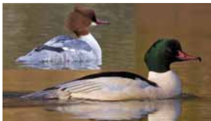
Gänsesäger ( Mergus merganser , oben ein Weibchen) sind im Winter im geschützten Mainabschnitt öfter zu Gast

Für nordeuropäische und sibirische Wat- und Wasservogel, die in Südwesteuropa oder Westafrika überwintern, ist das untere Maintal eine wichtige Durchzugstraße. Gewässer, Ufergehölze, Wiesen und Felder bieten Nahrung und geschützte Rastplätze. Der Mainabschnitt zwischen Mühlheim und dem Rumpenheimer Schloss und das Naturschutzgebiet „Rumpenheimer und Bürgeler Kiesgruben“ wurden deshalb als „Europäisches Vogelschutzgebiet“ ausgewiesen. Regelmäßig fischen hier