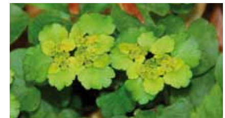
Wechselblättriges Milzkraut ( Chrysosplenium alternifolium ) wächst hauptsächlich am südlichen Hainbach

An den Böschungen des oberen Hainbachabschnitts, zwischen Landesstraße 3001 (Dietzenbacher Straße) und der Stadthalle an der Waldstraße, tritt Grundwasser an vielen Stellen in Quellsümpfen zutage.