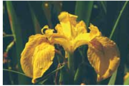
Sumpfschwertlilien ( Iris pseudacorus ) blühen an Grabenrändern im Norden und Westen sowie in der Nasswiese im Süden

Kuckuckslichtnelken überzogen. Nur noch selten entwickeln sich an Blättern des Großen Sauerampfers die Raupen der metallisch schimmernden Grünwidderchen . Von Baumwipfeln am Südrand der Wiesen steigt im Frühsommer der selten gewordene Baumpieper zu Singflügen auf.