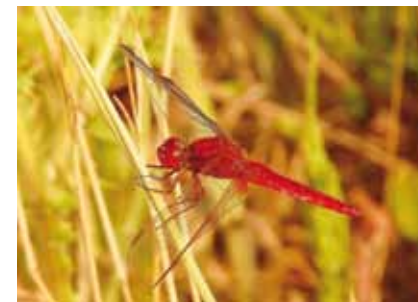
Feuerlibellen ( Crocotthemis erythrea ) breiten sich seit etwa 20 Jahren ständig weiter nach Norden aus

Die mittelgroße, auffällig leuchtend rot gefärbte Feuerlibelle kam bis in die 1980er Jahre nur gelegentlich als Sommergast in Südwestdeutschland vor. Ab Mitte der 1990er Jahre trat sie mit zunehmender Häufigkeit auch in Hessen auf und ist inzwischen fester Bestandteil der hessischen Libellenfauna. In Offenbach ist sie