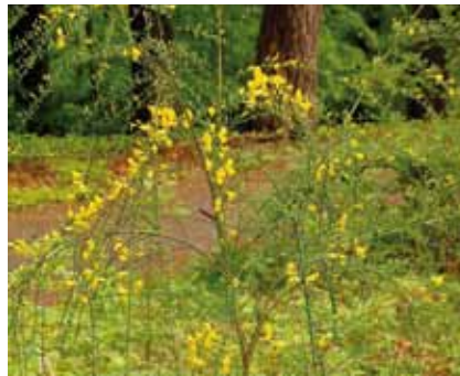
Am südlichen Lohwald und an sonnigen, sandigen Plätzen im Stadtwald wächst Besenginster ( Cytisus scoparius )

wenigen aufkommenden Sämlinge abweideten. Rücksichtsloser Holzeinschlag vor der Auflösung der Markgenossenschaft verwüstete die Wälder endgültig, so dass ein Zeitzeuge im späten 18. Jahrhundert unsere Gegend drastisch als „schauerliche Einöde“ beschrieb (Wittenberger 1982). In die stark gelichteten Wälder mit ausgelaugten, kiesel-sauren und humus-armen Böden wanderten anspruchslose, Säure liebende Pflanzen, wie Heidekraut , Heidelbeere , Preiselbeere , Besenginster , Salbeigamander und Polster des heute geschützten Weißmooses ein.