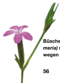
Büschelnelken ( Dianthus armeria ) sind an grasigen Waldwegen vereinzelt zu finden

KNAPP, S. 2008: Vielfalt vor der Haustür, Forum Geoökologie, 2008: https://www.ufz.de/export/data/1/37972_Knapp_2008_Forum_Geo%C3%B6kologie.pdf . [Zuletzt besucht: 18-Oct-2013].