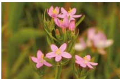
Das Echte Tausengüldenkraut ( Centaureum erythraea ) kommt auf grasigen Wegen im Lohwald vor

Kleine Mulden in diesem Bereich weisen auf den Einsturz unterirdischer Hohlräume hin. Solche Höhlungen entstehen bei der Auflösung kalkhaltigen Gesteins durch kohlenstoffhaltiges Sickerwasser.