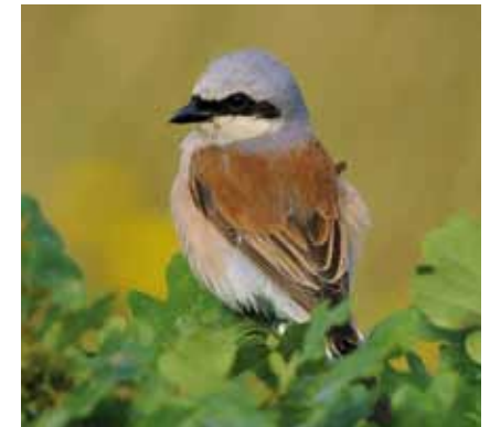
Der Rotrückenvürger ( Lanius collurio ) brüdet in Dornhecken, zum Beispiel am Lohwald und auf dem Buchhügel

Als linienhafte Biotope bildeten Hecken die Verbindung zu Feldgehölzen und Wäldern als geschützte Wanderwege für Kleintiere. Noch vor wenigen Jahrzehnten prägten sie große Teile des ländlichen Raumes in Europa. Die Mechanisierung der Landwirtschaft mit dem Einsatz immer größer werdender Maschinen erforderte die Bildung großer, zusammenhängender Schläge. Die Hecken wurden gerodet und die reich gegliederte Kulturlandschaft in „maschinengerecht“ zu bearbeitende, monotone Produktionsflächen verwandelt. Mit der Beseitigung der Hecken verschwanden auch viele ihrer Bewohner. In Offenbach sind die meisten davon heute selten oder völlig ausgestorben.