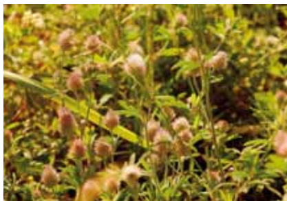
Hasenklee ( Trifolium arvense ) wächst auf mageren Sandböden. Seine Blütenköpfe erinnern an Hasenschwänze

Entlang der Mähwiesen und Pferdekoppeln erinnern sie jedoch an bunte Blumenwiesen. Zwischen brachgefallenen Flächen im Süden von Bieber haben die Blumen der Wegraine sogar die sandigen Feldwege und Brachflächen erobert.