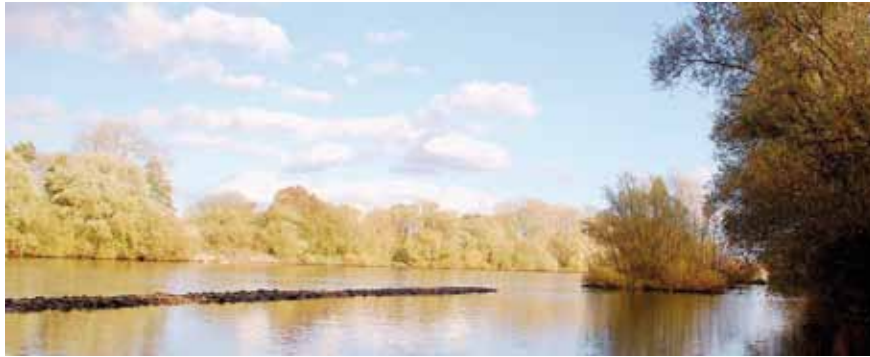
Der Main an der Grenze zwischen Rumpenheim und Mühlheim im Herbst – Teil des europäischen Vogel-schutzgebiets „Main bei Mühlheim und Naturschutzgebiet Rumpenheimer und Bürgeler Kiesgruben“; Blick nach Nordost

Für nordeuropäische und sibirische Wat- und Wasservogel, die in Südwesteuropa oder Westafrika überwintern, ist das untere Maintal eine wichtige Durchzugstraße. Gewässer, Ufergehölze, Wiesen und Felder bieten Nahrung und geschützte Rastplätze. Der Mainabschnitt zwischen Mühlheim und dem Rumpenheimer Schloss und das Naturschutzgebiet „Rumpenheimer und Bürgeler Kiesgruben“ wurden deshalb als „Europäisches Vogelschutzgebiet“ ausgewiesen. Regelmäßig fischen hier