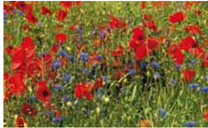
Roter Klatschmohn ( Papaver rhoeas ) und blaue Kornblumen ( Centaurea cyanus ), unsere bekanntesten Ackerwildkräuter

eingeführt wurden. Flachs wurde als Lieferant spinnfähiger Fasern gepflanzt. Die ölhaltigen Samen waren ein wertvolles Nahrungsmittel.