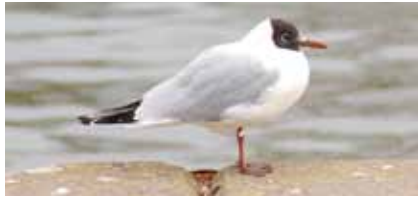
Lachmöwe ( Larus ridibundus ) im Sommergefieder; im Winter ist der Kopf weiß mit einem seitlichen grauen Ohrfleck

Nach Bürgel hin wachsen am Ufer weniger Gehölze. Schilf, Ästiger Igelkolben , verschiedene Binsenarten und Seggen , gelbe Sumpfschwertlilien und rosenroter Blutweiderich sind hier häufiger. Drüsiges Springkraut breitet sich seit einigen Jahren aus. Ob dies längerfristig negative Auswirkungen auf den Lebensraum haben wird, ist derzeit nicht absehbar. ■