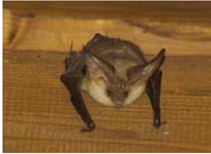
Fledermäuse sind heimliche Mitbewohner. Am Stadtrand können sogar Langohren (Gattung Plecotus ) in Häusern leben

Fledermäuse tagsüber. In der Humboldtstraße bietet ein Dachboden sogar einer ganzen Fledermauskolonie Platz. Muttertiere bringen hier Junge zur Welt und versorgen sie, bis diese selbstständig sind.