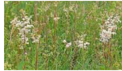
Mädesüß ( Filipendula ulmaria ) entwickelt auf brachfallenden Wiesen große Bestände

Sobald feuchte, gut mit Nährstoffen versorgte Wiesen nicht mehr regelmäßig gemäht werden, stellt sich hier das Mädesüß ein. Am Mainufer, im Kuhmühltal zwischen Bürgel und Rumpenheim, in den Feuchtwiesen des südlichen Biebertals und am südöstlichen Buchhügel bildet es große Bestände. Der an Honig erinnernde süße Blütenduft ist an sonnigen Hochsommertagen weithin wahrzunehmen. Seine Blüten werden von zahlreichen Insekten besucht.