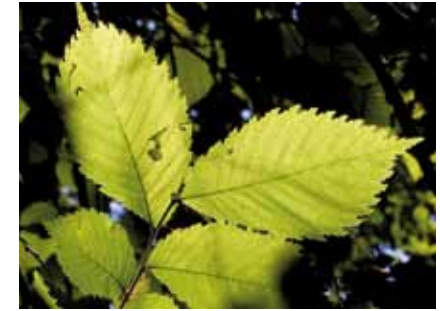
Doppelt gesägte Blätter und der asymmetrische Blattgrund machen die Flatterulme ( Ulmus laevis ) unverwechselbar

Der Wald entlang der Heusenstammer Feldschneise ist durch Forstwirtschaft geprägt. Die Hauptbaumarten sind hier Buche und Kiefer , untermischt mit Hainbuche , Spitz- und Bergahorn und einzelnen Flatterulmen .