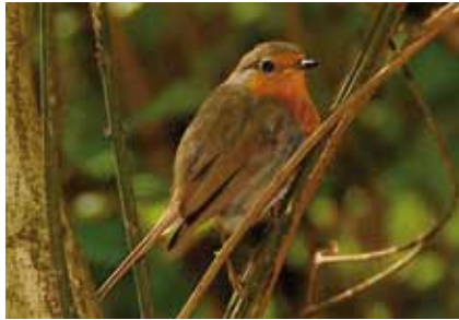
Das Rotkehlchen ( Erithacus rubecula ) ist ein typischer Vogel unterholzreicher Laubwälder, Feldgehölze und Gärten

schon im Vorfrühling aus den Baumkronen der Gesang der Misteldrossel . Mit unterschiedlich langen und schnellen Trommelwirbeln machen sich Schwarzspecht , Mittelspecht und Buntspecht bemerkbar. Wie Gelächter klingen die Rufreihen von Grünspecht und Grauspecht , und fast den ganzen Tag sind die melancholischen Lieder der Rotkehlchen zu hören.