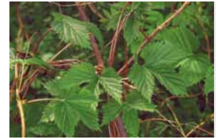
Auenwälder sind die ursprünglichen Standorte des Hopfens ( Humulus lupulus ), wo dieser an Gehölzen emporwindet

Im Sand unbefestigter Uferabschnitte können zahlreiche Muschel- und Wasserschnecken, hauptsächlich von aus Ostasien eingeschleppten Körbchenmuscheln , gefunden werden. In befestigten Abschnitten sitzen an Steinen unter der Wasserlinie Dreikantmuscheln , die vom Kaspischen Meer nach Europa gelangt sind.