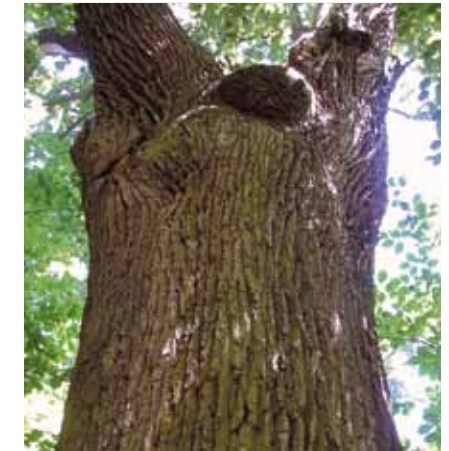
Das Naturdenkmal „August-Reiß-Eiche“ ist über 430 Jahre alt und misst fast zwei Meter im Durchmesser

Etliche sehr alte Bäume, darunter der älteste Baum Offenbachs, die „August-Reiß-Eiche“, verdanken wohl ihr Überleben diesen strengen Regularien.