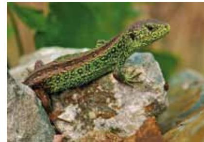
Zauneidechsen ( Lacerta agilis ) finden am Südrand des Lohwaldes beste Lebensbedingungen

Blindschleichen machen hier Jagd auf Kleintiere. Sie sind Eidechsen, die in der Entwicklungsgeschichte den Gebrauch der Beine aufgegeben haben.