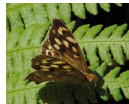
Das Waldbrettspiel ( Pararge aegeria ) ist einer der wenigen Tagfalter, die in halbschattigen Wäldern leben

Auch die bizarre Einbeere bildet in diesem Bereich größere Bestände. Abschnitte mit geschlossenem Kronendach wechseln