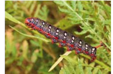
Mit Warnfarben signalisiert die Wolfsmilchschwärmerraupe ( Hyles euphorbiae ) Vögeln, dass sie ungenießbar ist

Haufen von Kalksteinbrocken im südlichen Teil der Streuobstwiese bieten gute Verstecke für eine kleine Population von Zauneidechsen. In einem Schutzprojekt zur Förderung dieser in der europäischen Union streng geschützten Art wurden Verbesserungen des Biotops vorgenommen und weitere Tiere angesiedelt, deren bisheriger Lebensraum durch Baumaßnahmen gefährdet ist.