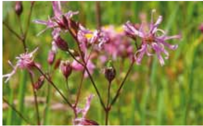
Die Kuckuckslichtnelke ( Silene flos-cuculi ) bildet auf feuchteren Wiesen südlich von Bieber stellenweise große Bestände

Blumen frischer Mähwiesen sind das weiße Wiesenlabkraut , die blauviolette Wiesenglockenblume , das rosenrote Breitblättrige Knabenkraut , Wiesenschaumkraut und Kuckuckslichtnelke . Sie prägen im Frühsommer das Landschaftsbild im nord-westlichen Teil des Naturschutzgebiets „Erlensteg von Bieber“ und Teile der südlichen Bieberaue.