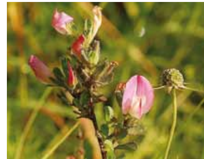
Kriechende Hauhechel ( Ononis repens ) am südlichen Lohwald, Weidezeiger auf kalkhaltigen Böden

„Zeigerpflanzen“ lassen uns erkennen, ob eine Wiese beweidet oder gemäht wird. Beim Mähen werden wahllos alle Pflanzen geschnitten; Weidende Tiere verschmähen dagegen Pflanzen mit unangenehmem Geruch oder Geschmack und solche, die durch Gifte, Stacheln oder Dornen geschützt sind. Feldmannstreu , Steppen- und Zypressenwolfsmilch , Thymian , Kriechende Hauhechel und Kleine Wiesenraute lassen auf einer von Dornhecken umgebenen Waldwiese am Südostrand des Lohwaldes erkennen, dass hier früher Tiere weideten.