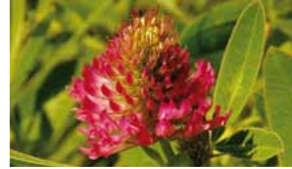
Der Hügelklee ( Trifolium alpestre ) kommt als Kalk liebende Art in Offenbach nur noch am Lohwald vor

Junge Aufforstungsflächen, Äcker und eine von Dornhecken umgebene, trockene Streuobstwiese mit artenreicher Vegetation und Insektenfauna folgen nach Westen bis zu dem künstlichen Taleinschnitt der S-Bahn-Strecke vom Ostbahnhof nach Bieber.