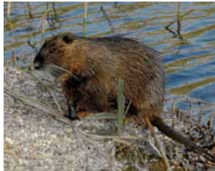
Die Nutria ( Myocastor coypus ) ist in Offenbach im Jahr 2012 zum ersten Mal beobachtet worden

nach Fressbarem und finden Verstecke in Gebäuden. Im Jahr 2006 wurden dem Umweltamt erste Beobachtungen in Offenbach mitgeteilt.