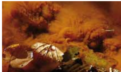
Eisenbakterien haben auf dem Grund des Wildhofbachs dicke Flocken von Eisenoocker ausgeschieden

Zur Erzeugung der fast doppelt so hohen Schmelztemperaturen für die Eisenverarbeitung muss in der Eisenzeit ab etwa 750 Jahre v. Chr. der Holzverbrauch nochmals gestiegen sein. Rohstoff der frühen Eisengewinnung war das weit verbreitete Raseneisenerz (Kroemer 2009), ein Umwandlungsprodukt des Eisenoockers . In einigen Quellrinsalen im Wald ist die Abscheidung von Eisenoocker durch spezialisierte Bakterien sichtbar.