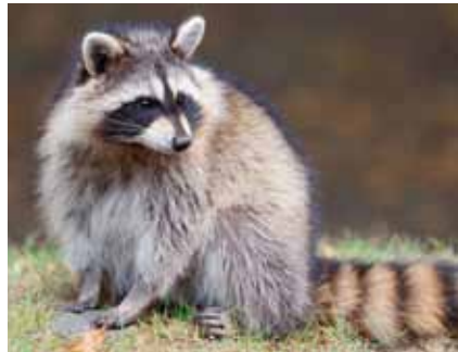
Der Waschbär ( Procyon lotor ) kann dank seiner großen Anpassungsfähigkeit unterschiedlichste Lebensräume besiedeln

ne Falter und Raupen an mehreren Orten in Südhessen beobachtet. Im östlichen Landkreis Offenbach wurden 2012 Buchssträucher von den Raupen kahlgefressen. Seit August 2013 traten an Buchs in Bieber und Rumpenheim zahlreiche Raupen auf. Die im Laub gut getarnten Larven fallen meist erst durch erhebliche Fraßschäden auf. Prognosen zur weiteren Ausbreitung dieses Schmetterlings sind noch nicht möglich.