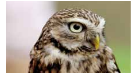
Der Steinkauz ( Athene noctua ) liebt alte Streuobstwiesen, wo hohle Obstbäume ideale Brutplätze bieten

Ausgefaltete Aststümpfe und hohle Stämme alter Obstbäume bieten einer Vielzahl von Tieren Verstecke und Nistgelegenheiten. Vom Laub der Bäume lebten viele Insektenarten. In Hessen stehen Streuobstwiesen aus diesem Grund unter Naturschutz.