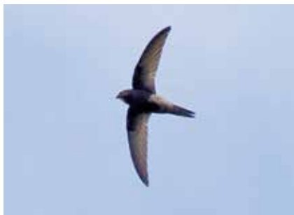
Bis in die Nacht sind im Sommer über den Dächern die schrillen Rufe kreisender Mauersegler ( Apus apus ) zu hören

Besonders beeindruckend sind die Schwärme der Mauersegler im Sommer über der Stadt. Die Tiere kommen pünktlich im Mai aus ihren Überwinterungsgebieten