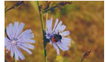
Die Wegwarte ( Cichorium intybus ), hier mit Steinhummel ( Bombus lapidarius ), ist die bekannteste Blume der Wegraine

Auf ungenutzten Streifen zwischen Äckern, an Wegrändern und als Säume von Hecken und Wäldern entwickeln sich Weg- und Feldraine als eigene Lebensraumtypen.