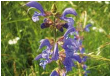
Die Blüten des Wiesen-Salbeis ( Salvia pratensis ) sind speziell auf Bestäubung durch Hummeln eingerichtet

Die rosenroten Blüten des Gemeinen Thymians und die tiefblauen Blüten des Wiesensalbeis locken mit reichem Nektarangebot zahlreiche Insekten an.