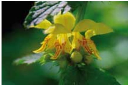
Die Goldnessel ( Galeobdolon luteum ) ist im Wald eine wichtige Nektarquelle für Hummeln und Wildbienen

Vor der Laubentfaltung im Frühling ist hier der Waldboden mit einem Teppich von Buschwindröschen , Scharbockskraut , Gundermann und anderen früh blühenden Stauden bedeckt. Als Nährstoffanzeiger blühen hier auch Goldnessel , Knoblauchrauke , seltener die Zwiebel-Zahnwurz , eine Verwandte des Wiesenschaumkrauts .