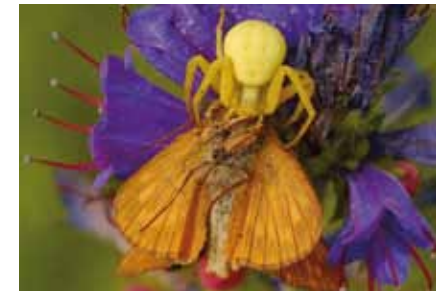
In Natterkopflüten versteckt, hat die Krabbspinne Misumena vatia einen Dickkopffalter ( Ochlodes sylvanus ) erbeutet.

Gräser, Kräuter und Stauden bilden ein buntes Gemisch unterschiedlichster Pflanzen. Wicken und Platterbsen klettern mit fädigen Ranken an anderen Pflanzen empor.