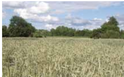
Unkrautbekämpfungsmittel haben auf dem Roggenfeld im Mainvorland das Aufkommen bunter Wildkräuter verhindert

Ackerwildkräuter wurden schon früher bekämpft, weil sie die Erträge mindern oder, wie Kornrade und Ackerwachtelweizen , mit ihren Samen das Mehl vergifteten. Doch erst mit dem Einsatz chemischer Präparate zur großflächigen Vernichtung der unerwünschten Konkurrenten wurde ihr Niedergang eingeleitet. Im Lauf eines halben Jahrhunderts wurden viele bunte, ehemals häufige Ackerwildkräuter selten, mit ihnen die zugehörigen Insekten.