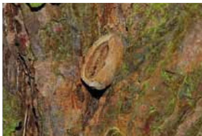
„Spechtschmiede“ in der Borke einer Lärche – hier hat ein Vogel eine Haselnuss zur Bearbeitung befestigt

Die beiden bei uns vorkommenden Arten, Garten- und Waldbaumläufer , sind in der Natur am leichtesten durch ihre Gesänge zu unterscheiden. Ihr größerer „Kollege“, der Kleiber , auch Spechtmeise genannt, kann sogar kopfüber die Stämme abwärts klettern. Mit seinen lauten, pfeifenden Revierrufen ist er schon im Vorfrühling nicht zu überhören. Größer als ein Sperling, mit blaugrauer Ober-