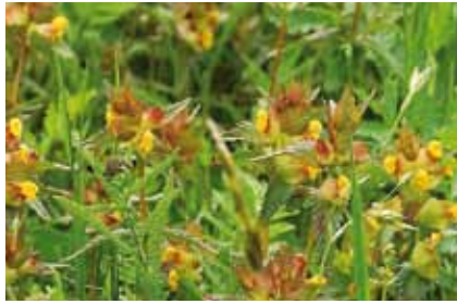
Der Kleine Klappertopf ( Rhinanthus minor ) entzieht als Halbparasit anderen Pflanzen Wasser und Mineralien

Wiesenbocksbart und der halbparasitisch lebende Klappertopf bilden weiße, blaue und gelbe Farbtupfer.