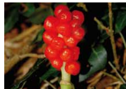
Die giftigen Früchte des Aronstabs ( Arum maculatum ) scheinen im schattigen Laubwald richtig zu leuchten

Im Unterholz wachsen Schlehe , Weißdorn , Hartriegel , Liguster , Traubenkirsche , Haselnuss und Schwarzer Holunder . In der Krautschicht sind Echtes und Knolliges Lungenkraut zu finden. Nach Nordosten setzt sich dieser Waldtyp bis zu der Kleingartenanlage mit einigen schönen alten Stieleichen und Buchen fort. Regelmäßiger Brutvogel sind hier der seltene Schwarzspecht und die sehr seltene Hohltaube .