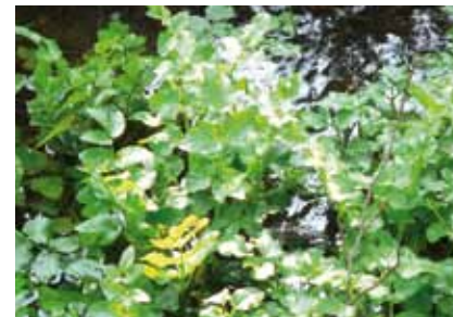
Bitteres Schaumkraut ( Cardamine amara ) wuchert im Frühjahr im Oberlauf des Wildhofbachs

Weniger struktureich ist der Wildhofbach mit seiner Aue. Er mündet bei dem Gelände der Arbeiterwohlfahrt in den Hainbach. Sein Untergrund besteht überwiegend aus nährstoffarmem Flugsand. Im schwach strömenden Abschnitt am Rand der Wildhofwiese wächst im Frühjahr Bitteres Schaumkraut , das leicht mit der schmackhaften Brunnenkresse verwechselt wird. Für Gewässerbiologen und Algenforscher interessant ist in diesem Bachabschnitt das Vorkommen der Froschlaichalge , einer im Süßwasser lebende Rotalge. Ihre bis zu 10 cm langen, bräunlich grün oder rotbraun gefärbten Büschel aus dicken, gallertigen Fäden sind im Frühjahr auf dem sandigen Bachgrund leicht zu sehen. Reichere Vegetation prägt die Bieber. Noch vor wenigen