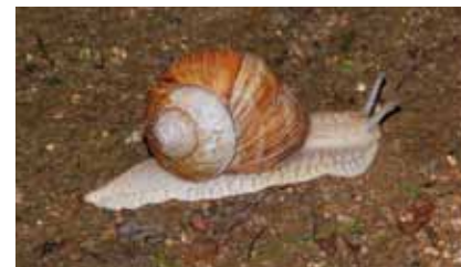
Weinbergschnecken ( Helix pomatia ) leben hauptsächlich in Hecken und lichten Wäldern auf kalkreichem Boden

Faulbaumbläuling und Nierenfleck, Schlehen- und Brombeerzipfelfalter, Kleines Nachtpfauenauge und Kupferglucke sind typische Schmetterlinge der Hecken. Dorngrasmücke, Goldammer, Girlitz, Heckenbraunelle und Rotrückenvürger , auch Neuntöter genannt, brüten in ihrem Schutz, auf der Sonnenseite der Hecken leben Zauneidechsen .