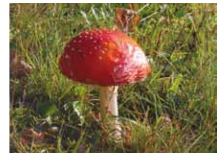
Der Fliegenpilz ( Amanita muscaria ) ist ein Birkenbegleiter auf leicht sauren Waldböden und an Wiesenrändern

Die als Mykorrhiza bezeichneten Lebensgemeinschaften von Pilzen mit höheren Pflanzen sind in Wäldern weit verbreitet. Förster wissen, dass pilzreiche Wälder besonders gesund sind. So bilden zum Beispiel die begehrten Steinpilze ebenso wie die tödlich giftigen Knollenblätterpilze mit Buchen und Eichen , andere Pilzarten mit Lärchen, Espen, Birken, Hainbuchen oder Kiefern für beide Seiten förderliche Beziehungen. Der hübsche Fliegenpilz