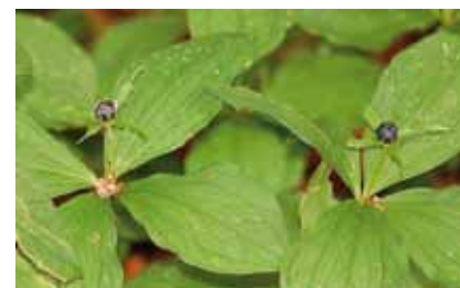
Die Einbeere ( Paris quadrifolia ) kommt nur im Lohwald und am Buchrainweiher vor. Sie liebt kalkhaltige Böden

Als typische Staude des „Hartholzauenwaldes“ ist der Aronstab , Vertreter einer in den Tropen artenreichen Pflanzenfamilie, zu finden.