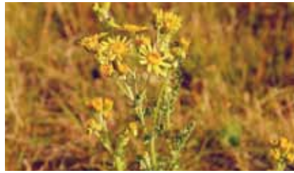
Begünstigt durch den Klimawandel ist das Jakobskreuzkraut ( Senecio jacobaea ) zum gefährlichen Weideunkraut geworden

Ihre Fähigkeit, bei geringer Feuchtigkeit zu keimen und in verdichteten, trockenen Böden zu wurzeln, hilft diesen Pflanzen, sich anzusiedeln. In einer geschlossenen Grasnarbe könnten sie sich nicht durchsetzen. Auch für Weidetiere gefährliche Pflanzen zählen hierzu: Das früher hauptsächlich auf Wegränder und trockene Brachflächen beschränkte, stark giftige Jakobs-Greiskraut entwickelte sich bei uns nach dem trockenen, extrem milden Winter 2006/2007 zu einem gefährlichen Weideunkraut. Besonders gefährdet sind dadurch in Offenbach übernutzte Pferdekoppeln.