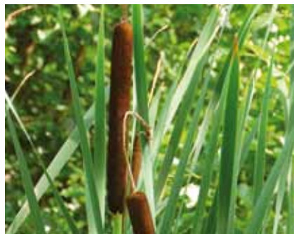
Breitblättriger Rohrkolben ( Typha latifolia ) kann als typische Pionierpflanze schnell feuchte Rohböden besiedeln

von Sumpf- und Wasserpflanzen helfen, neue Gewässer schnell zu begrünen.