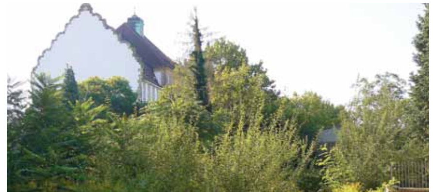
Auf unbebauten Grundstücken siedeln sich etliche Pflanzenarten an, und viele Kleintiere finden hier neue Lebensräume

Die in Siedlungen gegenüber der Umgebung höheren Durchschnittstemperaturen und geringere Luftfeuchte lassen erwarten, dass künftig, durch Klimawandel und Globalisierung begünstigt, auf diesen innerstädtischen Kleinlebensräumen noch mehr Tiere und Pflanzen aus wärmeren Ländern heimisch werden. ■