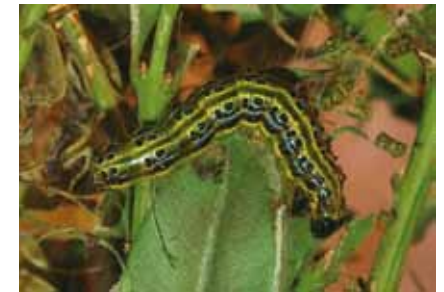
Parasitische Pilze und Raupen des Buchsbaumzünslers ( Cydalima perspectalis ) sind die größten Feinde der Buchssträucher

und in der Umgebung des Buchrainweihers gefunden werden. Auswirkungen auf die Vegetation der besiedelten Lebensräume sind nicht bekannt.