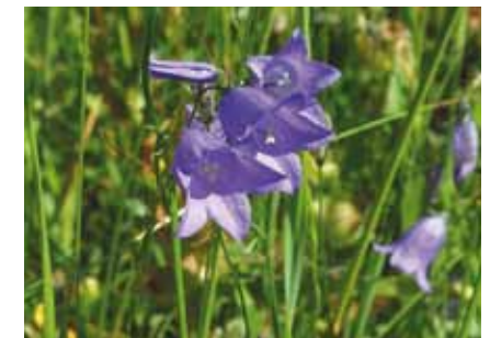
Die Rundblättrige Glockenblume ( Campanula rotundifolia ); Schmuck trockener Mähwiesen in Biebers Süden

Trockenere artenreiche Mähwiesen mit rosa Flockenblumen , dem leuchtend gelben Echten Labkraut , blau blühenden Rundblättrigen Glockenblumen und Wiesensalbei liegen am südlichen Buchhügel und im südlichen Biebertal.