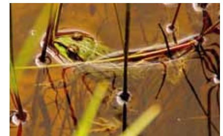
Der Wasserfrosch ( Pelophylax „esculentus“ ) lässt ab Ende April sein lautes Quaken hören

seltene Moorfrosch . Später folgen Erdkröte und Teichmolch , und ab Ende April ist das Quaken der grünen Wasserfrösche bis in den Herbst zu hören. Der vor 20 Jahren noch seltene, in der Europäischen Union streng geschützte Springfrosch ist hier sogar häufig geworden. ■