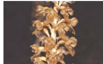
Die Nestwurz ( Neottia nidus-avis ) ist im rotbraunen vorjährigen Buchenlaub oft nur schwer zu finden

Nur wenige Pflanzen können unter den schlechten Lichtverhältnissen solcher Standorte gedeihen. Ohne Blattgrün lebt die Nestwurz in einer komplexen „Dreierbeziehung“ als Parasit von den Stoffwechselprodukten eines unterirdischen Pilzes, der wiederum in einer Gemeinschaft mit Buchenwurzeln lebt.