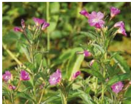
Das Zottige Weidenröschen ( Epilobium hirsutum ) wächst häufig an Gewässerrändern

Neben seltenen Sauergräsern ist hier als floristische Besonderheit das Ruhr-Flohkraut zu finden. Diese attraktive Blume ist in Hessen gefährdet und kommt in Offenbach nur hier und am Hainbachufer südlich des Spesarrings vor. Am Grabenrand blüht auch das rosafarbene Zottige Weidenröschen .