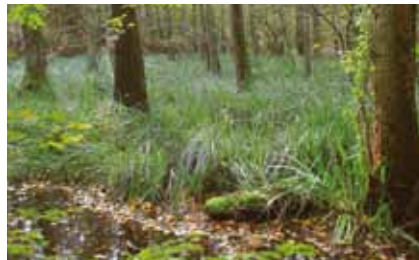
Westlich der Dietzenbacher Straße liegt im Wald versteckt der verlandete Deutscherrenweiher

nahen Sumpfwald entwickelt. Wäre nicht der Lärm von der nahegelegenen Autobahn und den in geringer Höhe anfliegenden Flugzeugen, könnte der Eindruck entstehen, dass man sich weitab von der Großstadt in unberührter Natur befände. Noch urtümlicher mutet der Sumpf westlich der Dietzenbacher Straße an: Oberhalb des alten Damms des verfallenen „ Deutscherrenweihers “, der in früheren Zeiten durch Aufstau des Hainbachs gebildet wurde, hat sich ein lichter Bestand von Schwarzerlen entwickelt. Im sumpfigen Boden wurzeln Steifsegge und Sumpfschwertlilie .