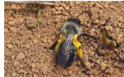
Die Silbergraue Sandbiene ( Andrena argentea ) gräbt ihre Brutröhren gerne in unbefestigte Feldwege und Böschungen

gelähmte Insekten und Spinnen eintragen. Heuschrecken legen ihre Eier in den sonnenwarmen Boden, und die Larven der räuberischen Sandlaufkäfer lauern in selbst gegrabenen senkrechten Röhren auf vorüberkommende Insekten, um sie mit ihren spitzen Kieferzangen blitzschnell zu ergreifen.