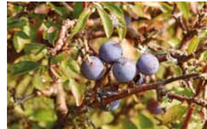
Die Schlehe ( Prunus spinosa ) ist der häufigste Strauch der Dornhecken. Ihre sauren Früchte sind nur nach Frost essbar

Schon die Bauern der Bronzezeit haben mit dornigen Wildsträuchern ihre Felder vor Vieh und Wildtieren, vor Austrocknung und Bodenabtrag durch den Wind geschützt. Haselnuss, Hagebutte, Mispel, Brombeere, Wildbirne, Schlehe und Kornelkirsche wurden gegessen, Reisig diente als Brennholz. Feldhecken sind von Menschen geschaffene, artenreiche Lebensräume.