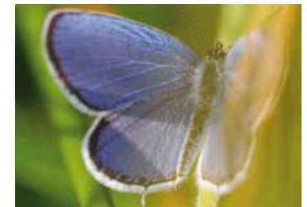
Männchen des Kurzschwänzigen Bläulings ( Cupido argiades ); die Weibchen sind schwarzgrau

Diese beiden Beispiele machen deutlich, dass Flora und Fauna auch ohne direkten menschlichen Zugriff veränderlich sind. Globale Veränderungen können schon innerhalb weniger Jahre die Ausbreitung von Tier- und Pflanzenarten beeinflussen. Wer noch immer am Klimawandel zweifelt, kann sich leicht durch einen Blick vor die eigene Haustür überzeugen. ■