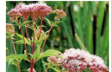
Der für Insekten attraktive Wasserdost ( Eupatorium cannabinum ) hat sich am nördlichen Deponiefuß angesiedelt

Stabile Pflanzengesellschaften mit entsprechender Tierwelt müssen sich auf den rekultivierten Flächen erst wieder entwickeln. Am Böschungsfuß hat, begünstigt durch abfließendes Regenwasser, im vormals trockenen Wald die Entwicklung einer artenarmen, Feuchtigkeit liebenden Hochstaudenflur mit Landreitgras , Flechtbinsen , Rohrkolben , Wasserdost und amerikanischen Goldruten begonnen.