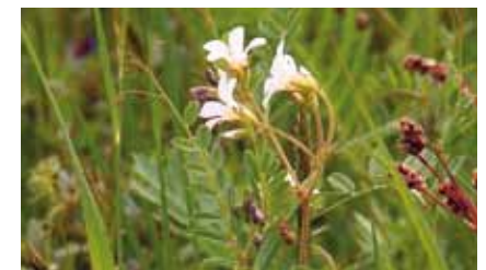
Der Körnchen-Steinbrech ( Saxifraga granulata ) ist auf den trockeneren Wiesen des Naturschutzgebiets häufig