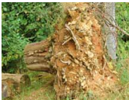
Rendzina und verwitterter, oberflächennaher Kalkfels sind im Ballen einer entwurzelten Buche zu erkennen

Östlich folgt ein Rest von Kalkbuchenwald. Im Rhein-Main-Gebiet kommt dieser in Hessen seltene Lebensraumtyp nur in kleinen Beständen auf den Kalkhügeln beidseits des Mains vor. Der bei der oberflächigen Kalkverwitterung entstandene rotbraune Boden ( Rendzina ) bietet für Orchideen wie das Weißer Waldvögelein , die Breitblättrige Stendelwurz und die Nestwurz ideale Standortbedingungen.