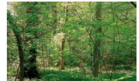
Der Edellaubholzreiche Hartholzauwald östlich der Sprendlinger Landstraße mit reicher Krautschicht im Frühling

Unmittelbar an die Bebauung grenzend finden wir auf nährstoffreichem, feuchtem Boden im Staatswald beiderseits der Sprendlinger Landstraße edellaubholzreichen „Hartholzauwald“, mit Stieleiche, Flatterulme, Bergahorn, Linde, Buche, Hainbuche und Esche . Die Strauchschicht besteht aus Haselnuss, Weißdorn, Schlehe und anderen Gehölzen.