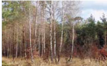
Auf der Windwurffläche an der Erlensteigschneise stehen Buchensetzlinge neben angeflogenen Birken und Erlen

Wiederbewaldung durch Samenflug zugelassen, wie auf dem Foto von einer Sturm-schadenfläche im südlichen Stadtwald zu sehen ist.