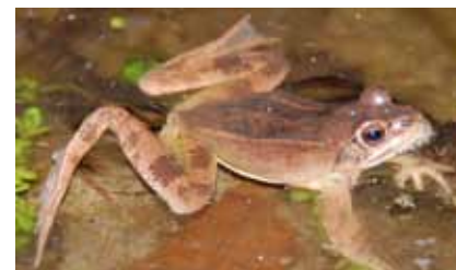
Der streng geschützte Springfrosch ( Rana dalmatina ) laicht bevorzugt im überfluteten Erlen-Eschen-Sumpfwald

Als typische Orchidee der Talwiesen blüht im Mai in zahlreichen Exemplaren das Breitblättrige Knabenkraut in der „Orchideenwiese“ westlich dieses Sumpfwaldes. Dauer-