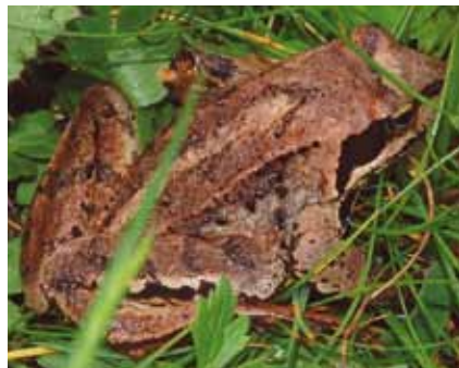
Der Grasfrosch ( Rana temporaria ) ist eher ein „Waldfrosch,“ der im vorjährigen Falllaub hervorragend getarnt ist

Häufige Bewohner dieses Lebensraumes sind Grasfrösche . Lehmgelbe bis rotbräunliche Körperfärbung mit braunen und schwarzen Flecken tarnen sie im welken Falllaub so gut, dass sie meistens erst bemerkt werden, wenn sie im Falllaub plötzlich aufspringen.