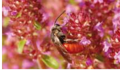
Blutbiene ( Sphecodes albilabris ) auf Thymian ( Thymus ); alle Blutbienen sind Brutparasiten bei anderen Wildbienenarten

Als Kalk liebende Rarität blüht hier auch der leuchtend rosenrote Hügelklee . Südlich und südwestlich dieser Wiese ziehen sich Ackerflächen bis zur Straße, die die Ortsteile Bieber und Waldheim verbindet. Hundszunge, Nickende Distel und als große Seltenheit der Kleine Frauenspiegel können hier an Wegsäumen und Acker-rändern gefunden werden, wo keine Herbizide verwendet werden.