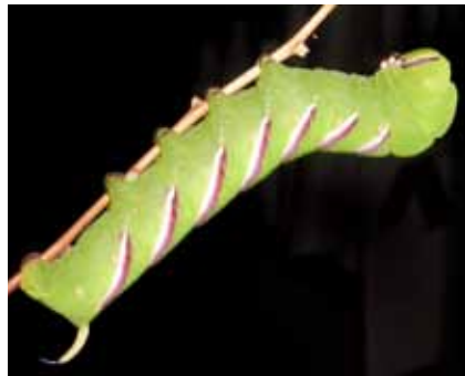
An Liguster, Forsythien und anderen Ziersträuchern in Gärten leben Raupen des Ligusterschwärmers ( Sphinx ligustri )

Urbanisierung – die Konzentration menschlichen Lebens in Städten, verbunden mit deren ständigem Wachstum – sehen naturverbundene Menschen überwiegend als die Vernichtung von Lebensräumen für Pflanzen und Tiere an. Auch in Offenbach, an den Rändern der Stadtteile Bieber, Bürger und Rumpenheim, wurden in jüngster Zeit neue Siedlungsflächen ausgewiesen, die den gewachsenen Wohnraumbedarf decken sollen. Die gemeinsam mit Frankfurt zu bewältigende Erschließung des Kaiserleigebiets wird im kommenden Jahrzehnt erfolgen.