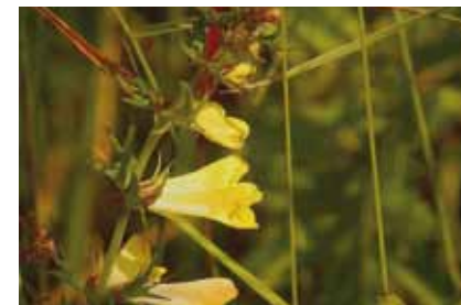
Wiesenschwammwurzler ( Melampyrum pratense ), halbparasitischer Bewohner lichter Stellen im Stadtwald

Auf ungewöhnliche Weise an nährstoffarme Standorte angepasst sind parasitische Pflanzen: Mit speziellen Saugwurzeln entziehen sie dem Gewebe anderer Pflanzen Nährstoffe und Wasser.