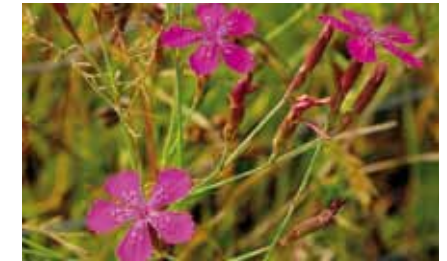
Die Heidenelke ( Dianthus deltoides ) blüht nur noch auf der südlichen Wildhofwiese und auf sandigen Feldwegen bei Bieber

Auf besonders nährstoffarmen, sandigen Böden wachsen die seltene Heidenelke , „Blume des Jahres“ 2012, und das Acker-Hornkraut .