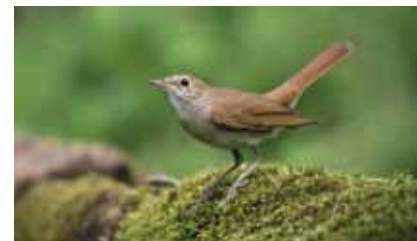
Im dichten Ufergebüsch des Rumpenheimer Mainufers brüten mehrere Nachtigallen ( Luscinia megarhynchos )

Überwuchert von Wildem Hopfen, Gemeiner Waldrebe und Bittersüßem Nachtschatten wirkt der schmale Auwaldrest fast dschungelartig. Ranken von Kratzbeeren und ein breiter Saum von Brennesseln und anderen Stauden schirmen das Gehölz gegen den nahen Weg ab. Nur das unerlaubte Freischneiden von Sitzplätzen zum Angeln führt hier öfter zu Beunruhigungen brütender Vögel.