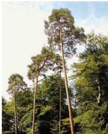
Kiefern ( Pinus silvestris ) können auch noch auf ausgelaugten Sandböden gut gedeihen

Erst gegen Mitte des 18. Jahrhunderts wurde mit Aufforstungen durch Aussaat von Eichen und Pflanzung junger Waldkiefern begonnen.