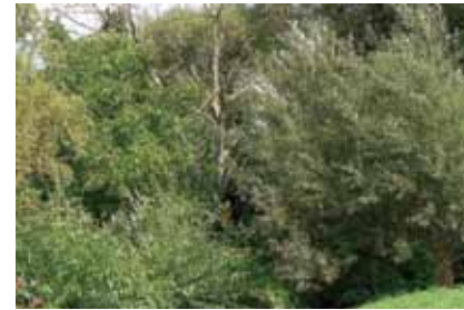
Ufersäume aus Silberweidengebüsch und anderen Gehölzen sind die Lebensräume zahlreicher Tierarten der Auen

Ein breiter Streifen von Weiden, Pappeln, Erlen und Eschen säumt die Ufer. Besonders naturnah ist dieser Biotoptyp östlich des Rumpenheimer Schlossparks bis zur Rodaummündung bei Mühlheim ausgebildet. Im morschen Holz alter Weiden leben hier Larven des seltenen Moschusbockkäfers , von ihren Blättern ernähren sich die Raupen des Abendpfauenauges , eines großen Nachtfalters.