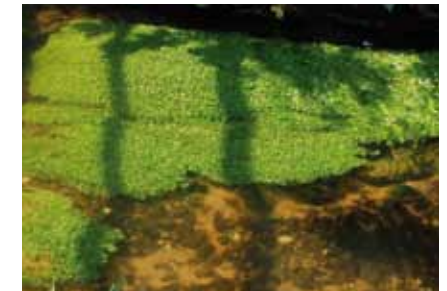
Unter den Büscheln des Wassersterns ( Callitriche ) verbergen sich Gründlinge und Schmerlen

Jahren war sie durch ungenügend geklärte Abwässer so stark belastet, dass hier nur wenige, an starke Verschmutzung angepasste Organismen existieren konnten. Nach Verbesserung der Leistung der Kläranlagen von Heusenstamm und Dietzenbach ist die Belastung des Bachs erheblich zurückgegangen. Nicht abbaubare Nährstoffreste und kaum gehemmte Sonneneinstrahlung begünstigen die Entwicklung eines reichen Pflanzenwuchses im Bachbett und an seinen Ufern. In der Strömung schwingende hellgrüne Büschel von Wasserstern zeigen, dass die Wasserqualität sich erheblich verbessert hat. Am Bachgrund versteckt lebende Gründlinge und Schmerlen jagen dort lebende Insektenlarven und Wasserasseln .