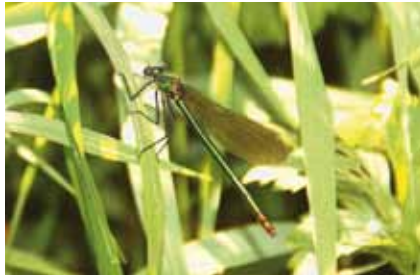
Die Gebänderte Prachtlibelle ( Calopteryx splendens ), hier ein Weibchen, ist an Bieber, Hainbach und Main wieder häufig