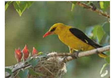
Der Pirol ( Oriolus oriolus ) wurde im Frühsommer 2013 im Naturschutzgebiet nach langer Abwesenheit wieder beobachtet

Im „Hartmannsrain“, wo das Gelände auf 118 Meter ü.NN ansteigt und trockener wird, zeigen fossilhaltige Steine in Maulwurfshäufen, auf Wegen und Äckern, dass Meeressedimente dicht unter der Oberfläche anstehen. Hahnenfuß -Arten, Körnchen-Steinbrech , Löwenzahn , Margerite , Rundblättrige Glockenblume , Wiesensalbei , Pippau ,