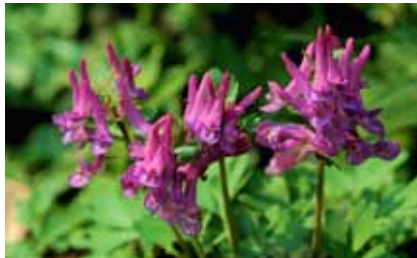
Bevor die Bäume Blätter treiben, blüht in Auwäldern der in Offenbach seltene Lerchensporn ( Corydalis solida )

Nur das Maiglöckchen blüht noch einige Tage nach der Laubentfaltung. Besonders auffallende Repräsentanten der Frühlingsgeophyten sind der als Wildgemüse beliebte Bärlauch und die attraktiven Lerchensporn -Arten. Nur auf leicht kalkhaltigen Böden gedeiht daneben auch das Gelbe Windröschen .