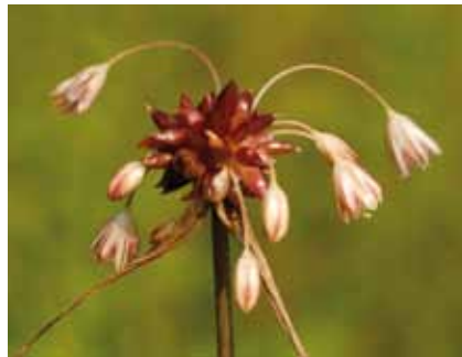
Auch der Kohl-Lauch ( Allium oleraceum ) zählt zu den Raritäten der Trockenwiese am Lohwald

Als Kalk liebende Rarität blüht hier auch der leuchtend rosenrote Hügelklee . Südlich und südwestlich dieser Wiese ziehen sich Ackerflächen bis zur Straße, die die Ortsteile Bieber und Waldheim verbindet. Hundszunge, Nickende Distel und als große Seltenheit der Kleine Frauenspiegel können hier an Wegsäumen und Acker-rändern gefunden werden, wo keine Herbizide verwendet werden.