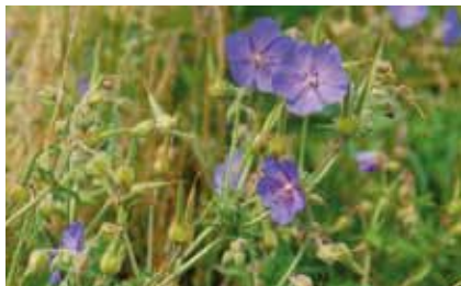
Der Wiesenstorchschnabel ( Geranium pratense ) ist im Frühsommer ein auffälliger Schmuck der „Talwiesen“

Auf den nährstoffreicheren Böden der „Flusstalwiesen“ werden sie oft durch den blau blühenden Wiesenstorchschnabel ersetzt. Solche Wiesen liegen in der Mainaue zwischen Bürgel und Rumpenheim, im „Kuhmühltal“ und in der Bieberaue.