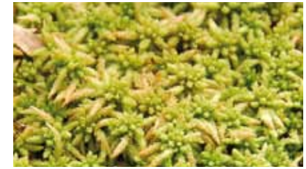
Torfmoose (Gattung Sphagnum ) kommen nur an wenigen Stellen im südlichen Stadtwald vor

Auf nährstoffarmen, nassen Standorten im südlichen Stadtwald sind vereinzelt kleine Bestände von Torfmoos zu finden. Torfmoospflanzen wachsen am oberen Ende ständig weiter, während die unteren Sprossabschnitte im dunklen, sauerstoffarmen Milieu absterben. Antibiotische Inhaltsstoffe schützen sie vor Zersetzung. So können die Moospolster in Hochmooren über Jahrtausende mächtige Schichten mit Abermillionen von Einzelpflanzen entwickeln. In Mooren sind weltweit unvorstellbare Mengen des klimaschädlichen Kohlendioxids gebunden. Die zarten, als Einzelpflanzen so hilflos erscheinenden Torfmoose haben somit erhebliche Bedeutung für den globalen Klimaschutz. An einem Waldgraben südwestlich der Wildhofwiese und an mehreren lichten Stellen im Stadtwald südöstlich von Tempelsee sind seine an Edelweiß