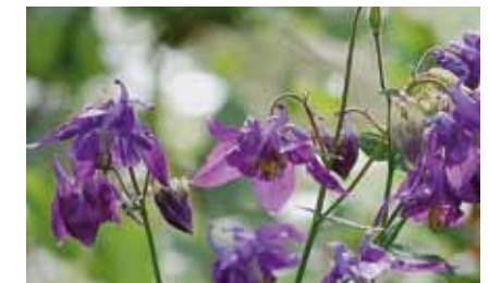
Die Akelei ( Aquilegia vulgaris ) ist aus dem Lohwald fast verschwunden

Zahlreiche Jungbuchen und andere Gehölze haben von der besseren Wasserversorgung profitiert. Der ehemals große Bestand der seltenen Akelei wurde vom dichter werdenden Unterholz schon fast verdrängt.