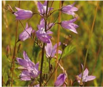
Mit über 70 cm Höhe ist die Ackerlockenblume ( Campanula rapunculooides ) eine der größten Glockenblumen bei uns

leuchten in verschiedenen Gelbtönen. Auf den blassrosa gefärbten Doldenrispen des Wilden Dosts tummeln sich Schmetterlinge, Bienen und Schwebfliegen.