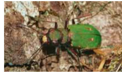
Auf sandigen Feldwegen geht der räuberische Feld-Sandlaufkäfer ( Cicindela campestris ) auf Jagd nach kleinen Insekten

Ständig befahrene oder festgetretene Wirtschaftswege mit spärlichem Pflanzenwuchs sind offene, von der Sonne leicht zu erwärmende Standorte. Hier graben Sand- und Pelzbiene ihre unterirdischen Brutzellen und versorgen sie mit Pollen als Larvennahrung. Auch Grab- und Wegwespen bauen hier ihre Nester, in die sie durch Stiche