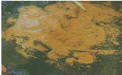
Quelltopf am Oberlauf des Hainbachs: Sprudelndes Wasser wirbelt ständig die Sandkörner auf

Selten treten in unserem Gebiet kleine Quellmulden mit sprudelnd aufsteigendem Wasser als Quelltöpfe auf.