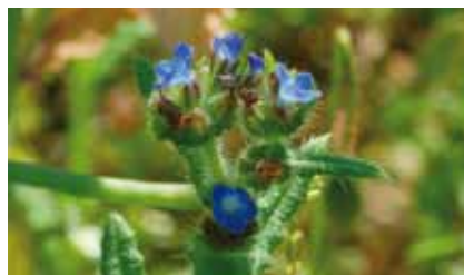
Acker-Krummhals ( Anchusa arvensis ) – ein Verwandter des Boretsch – in einem Rapsfeld im NSG Erlensteg

Im Wald östlich der Wiesen staut sich in alten Talmulden der heute viel weiter westlich fließenden Bieber im Frühling und in