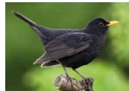
Die Amsel ( Turdus merula ) ist vom scheuen Waldvogel innerhalb eines Jahrhunderts zum Stadtbewohner geworden

Tiere mit speziellen Lebensraumansprüchen können in Städten nur schwer Fuß fassen. „Generalisten“, anpassungsfähige Tiere, haben es dagegen leichter (Cleargeau & Al. 2006). Zu dieser Gruppe zählt die Amsel , die uns, auf dem Dachfirst sitzend, in der Frühe mit ihrem lauten und markanten Gesang weckt. Als ehemalige Waldvögel haben Amseln in wenigen Jahrzehnten Stadtpopulationen entwickelt, die sich sogar genetisch von den Waldpopulationen unterscheiden (Partecke & Al. 2004). Kohlmeisen singen in Städten lauter – vermutlich, um den Stadtlärm zu übertönen, und Stare imitieren sogar Handy-Klingeltöne in ihren Gesängen.