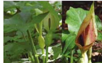
Aronstab ( Arum maculatum ) – junge Blüten (links) locken Bestäuber an. Die Hülle bestäubter Blüten färbt sich rötlich.

Wie ein Besucher aus tropischen Ländern wirkt im grünen Teppich der Auwaldpflanzen der Aronstab . Nachts lockt er mit leichtem Aasgeruch kleine Käfer und Fliegen in seine blassgrünen Blütenhüllen.