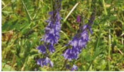
Großer Ehrenpreis ( Veronica teucrium )

Wirbeldost, Weiße Turmschnecke , zahlreiche Tagfalterarten, Wolfsmilchschwärmer, Dorngrasmücke, Goldammer und Neuntöter sind nur einige der vielen hier vorkommenden Arten.