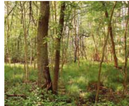
Der lichte Erlen-Eschen-Sumpfwald im Nordosten des Naturschutzgebiets wird im Frühling regelmäßig überschwemmt

nassen Jahren das Wasser und überflutet große Flächen.