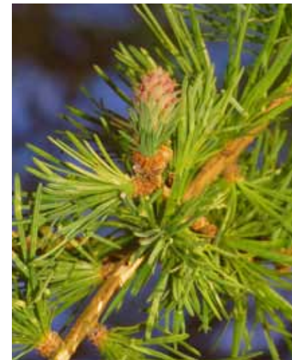
Die Lärche ( Larix decidua ) ist der einzige europäische Nadelbaum, der im Herbst die Nadeln verliert

Aus forstwirtschaftlicher Sicht geschätzte Eigenschaften, wie schnelles, gerades Wachstum, leicht zu bearbeitendes Holz mit guten mechanischen Eigenschaften und mäßige Ansprüche an den Boden waren die Gründe, im 19. Jahrhundert große Flächen mit Fichten aufzuforsten. Aus den Hochlagen der Alpen wurden zudem Lärchen eingeführt