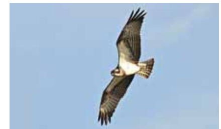
Im Frühjahr 2013 hielt sich ein Fischadler ( Pandion haliaetus ) über mehrere Wochen im Schutzgebiet auf

Die Wasserqualität des Sees ist ständig kritisch zu beobachten, um Schäden am Ökosystem zu verhindern. ■