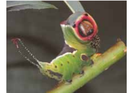
Die erschreckte Raupe des Großen Gabelschwanzes ( Cerura vinula ) geht in Abwehrstellung gegen Feinde

Am hinteren Körperende stülpt sie gleichzeitig zwei rote Fäden ähnlich Schlangenzungen aus. Zusätzlich kann sie aus einer Drüse unterhalb des Kopfes Ameisensäure über 30 cm weit verspritzen.