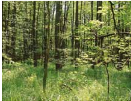
Auch der staudenreiche Erlensumpfwald an der „Kalten Klinge“ zählt zu den seltenen Biototypen in Hessen

Südlich des Lauterborngiets, im Staatswald an der „Kalten Klinge“, ist reiner Erlensumpfwald mit reichem Unterwuchs von Seggen, Farnen und diversen Moosen besonders schön entwickelt. Das Forstamt Langen hat diesen Waldabschnitt als „Kernfläche“