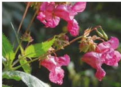
Das Drüsige Springkraut ( Impatiens glandulifera ) kann innerhalb weniger Jahre große Flächen erobern

Das attraktive Drüsige Springkraut kam als Zierpflanze in der ersten Hälfte des 19. Jahrhunderts aus dem westlichen Himalaya nach Europa. Obwohl die Pflanze in anderen Bundesländern schon Anfang des 20. Jahrhunderts auftrat, wird sie in der