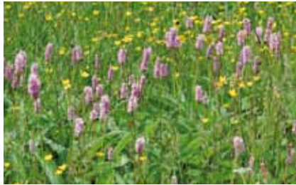
Der hauptsächlich in Moorwiesen vorkommende Schlangenknöterich ( Polygonum bistorta ) wächst nur noch in Bieber

geliebten Schlangenknöterichs kommt noch auf einer Mähwiese östlich des Friedhofs Bieber vor.