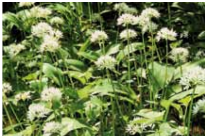
Auch der Bärlauch ( Allium ursinum ) kommt in Offenbach nur noch an wenigen Standorten vor

Bärlauch , Lerchensporn und Gelbes Windröschen kommen noch im Rumpenheim Schlosspark vor. Im Hainbachtal fehlt der Lerchensporn , und in der Umgebung des Buchrainweiher wächst nur noch das Gelbe Windröschen . Da die Bärlauchbestände in Offenbach relativ klein sind, sollte beim Ernten der Pflanzen als Wildgemüse Zurückhaltung geübt werden. Riskant sind Vergiftungen durch Verwechslung mit den Blättern des stark giftigen Maiglöckchens , das an manchen Stellen gemeinsam mit Bärlauch wächst.