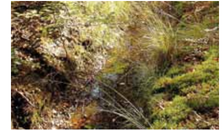
Die alten Drainagegräben im Stadtwald haben sich zu artenreichen Lebensräumen entwickelt

Hoher Grundwasserstand erforderte für Aufforstungen, planmäßige Bewirtschaftung und Wegebau zunächst die Trockenlegung der meisten Flächen durch tiefe Gräben. In zwei Jahrhunderten haben sich diese zu Kleinbiotopen mit eigener Pflanzen- und Tierwelt entwickelt.