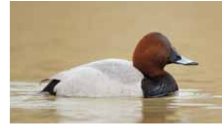
Rostroter Kopf, grau erscheinender Rücken, dunkle Brust und Schwanzpartie: Eine männliche Tafelente ( Aythya ferina )

Während männliche Tafelenten leicht zu erkennen sind, unterscheiden sich die Weibchen von weiblichen Reiherenten aus der Ferne nur durch die dunklen Augen und das Fehlen des Federschopfs am Hinterkopf.