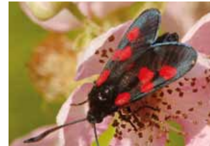
Kleewidderchen ( Zygaena trifolii und Zygaena lonicerae ) werden durch Düngung der Wiesen verdrängt.

Konkurrenten durch. Die ursprünglichen Magerrasenpflanzen und die von ihnen abhängigen Tiere verschwinden.