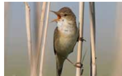
Singende Teichrohrsänger ( Acrocephalus scirpaceus ) sind in den letzten Jahren im Gebiet mehrfach festgestellt worden

Selten baut auch der Schilfrohrsänger sein korbartiges Nest zwischen Pflanzenstängel im Röhricht, und der seltene Pirol brütet hier seit zwei Jahren wieder. Fischende Graureiher halten sich täglich am See auf.