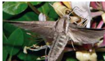
Kiefernswärmer ( Hyloicus pinastri ) und andere Nachtfalter saugen gerne an Geißblattblüten ( Lonicera periclymenum )

Andererseits könnte die weitere Ausbreitung der im Südwesten des Gebiets auftretenden Neophyten Schlitzblättrige Brombeere , Drüsiges Springkraut und Fiederblättriger Spierstrauch schutzwürdige Biotope gefährden. ■