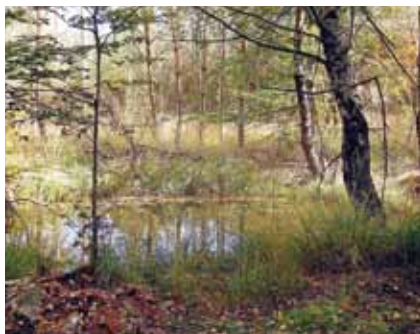
Der verwachsene Bombentrichter im südliche Stadtwald erinnert an einen stillen Moortümpel

Unser größtes stehendes Gewässer, der „Schultheisweiher“, wird in einem eigenen Kapitel beschrieben. Hier sollen nur kleine, überwiegend im Wald verborgene Stillgewässer vorgestellt werden.