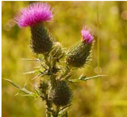
Die Lanzett-Kratzdistel ( Cirsium vulgare ) ist so stachelig, dass nur Esel und Ziegen sie anrühren.

Hoher Viehbesatz überfordert das Regenerationsvermögen der Weidepflanzen. Schnell entstehen erhebliche Vegetationsschäden. Fressbare Pflanzen werden völlig abgegrast, empfindlichere Arten durch Bodenverdichtung und Viehtritt geschädigt oder vernichtet. Auf entstehenden Kahlstellen werden flugfähige Samen von „Weideunkräutern“ angeweht. Disteln werden wegen ihrer Stacheln kaum gefressen.