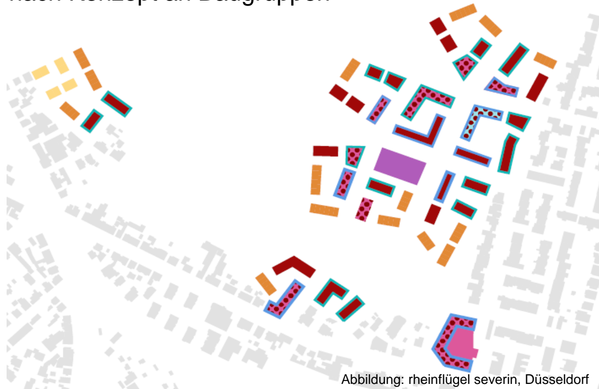
Abbildung: rheinflügel severin, Düsseldorf