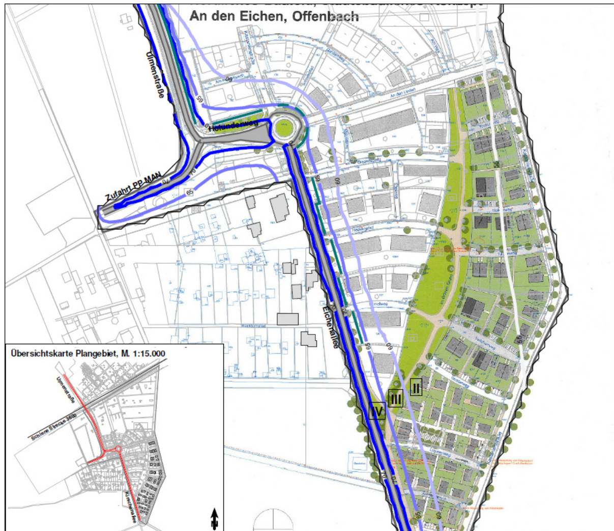
Abbildung 1: Gemäß DIN 4109 unter Berücksichtigung der im Bebauungsplan 618 A festgesetzten aktiven Lärmschutzmaßnahmen ermittelten Lärmpegelbereiche